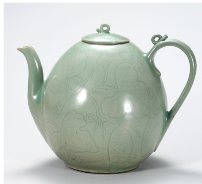
Fig. 1. <청자 상감포도문 표형 주자> Celadon Gourd-shaped Ewer with Inlaid Grapes Design, Koryŏ, H, 31.8cm, Excavated from Kaesŏng, National Museum of Korea