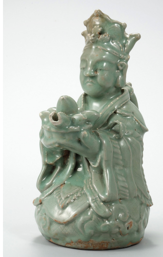
Fig. 3. <청자 석류형 주자> Celadon Pomegranate-shaped Ewer, Koryŏ, H. 18.3cm, National Museum of Korea