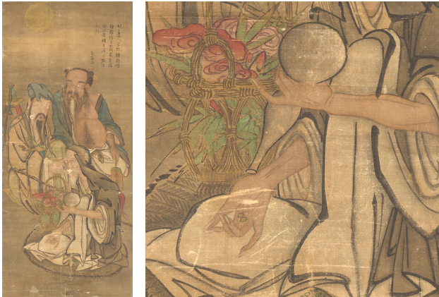
Fig. 15. 김홍도, <신선의 부분> Kim Hongdo (1745~?), Immortal (Left) and Detail of Immortal (Right), Chosŏn, 131.5×57.6 cm, National Museum of Korea (National Museum of Korea, https://www.emuseum.go.kr )

1806?)의 그림과 姜世晁(1713~1791)의 발문을 통해서도 호로병에 금단을 넣고 다녔다는 것을 확인할 수 있다(Fig. 15). 40