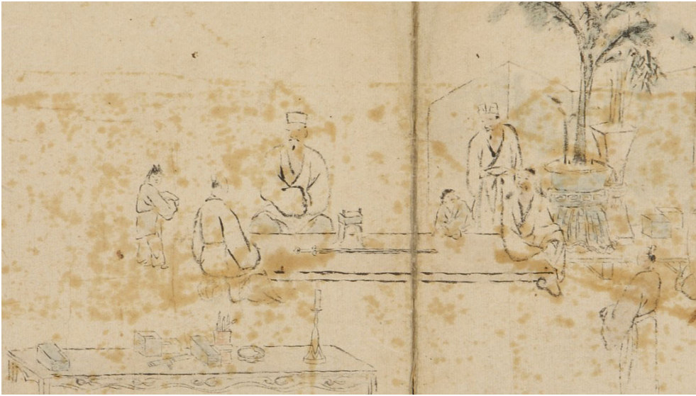
Fig. 14. 이인상, <이인상 화첩의 부분> I Insang (1710~1760), Calligraphy and Painting Album by I Insang (detail), Chosŏn, 32.4×23.2cm, National Museum of Korea

상형청자 향로는 뛰어난 조형성으로 국가적, 종교적인 의례 외에도 宴會나 玩賞의 자리에서 중요한 역할을 수행하였다. 상형청자가 내뿜는 香薰과 香煙은 연회의 공간을 속세에서 분리된 듯한 理想的인 공간으로 만들었다. 30 당대 상류층은 현실적 권력에 연연하지 않고 산림에 은거하는 隱逸을 추구하였는데, 이는 無爲自然을 지향하는 도교적 세계관이 반영된 것이다. 이들은 속세에서 분리된 이상적인 공간을 조성하기 위해 노력했는데, 그 중심이 되는 공간이 書齋였다. 서재는 단순히 책을 읽고 글을 쓰는 곳에 그치지 않고, 취미를 공유하고 함께 교류하는 공간이었다. 서화를 감상하거나 琴을 연주하고 차와 향을 함께 나누었으며, 진귀한 기물이나 동식물 등을 함께 완상하며 교류하였다. 또한 왕실에 御苑이 있는 것처럼 권세가들은 자신의 공간에 庭園, 花園을 가꾸었으며, 연못을 조성하기도 했다. 31 盆栽를 키우고 花階를