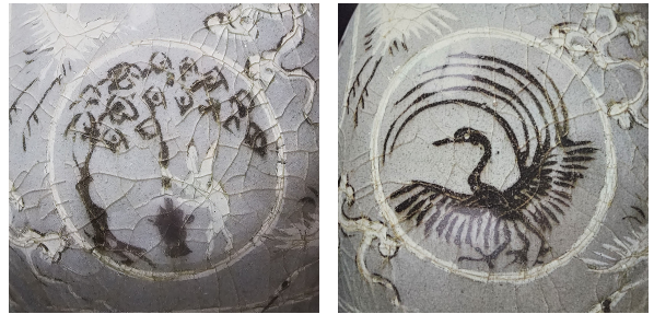
Fig. 6. <청자 상감포도문 표형 주자의 부분> Celadon Gourd-shaped Ewer with Inlaid Grapes Design (detail), Koryŏ, H. 38.6cm, Museum of Oriental Ceramics, Osaka (Museum of Oriental Ceramics, Sparkles of Jade Koryŏ Celadon , pp. 250-251)

토끼는 다산의 상징이자, 설화 속의 친근한 동물이다. 하지만 토끼를 기명의 소재로 사용하는 경우는 흔하지 않은데, 향로 중에 토끼가 등장하는 독특한 조형의 청자 향로가 있다(Fig. 5). 고려청자에 토끼 도상은 다소 생소하게 느껴지지만, 상감청자의 문양으로 등장하는 경우가 드물게 있다. 일본 오사카시립동양도자미술관 소장 <청자 상감포도문 표형 주자>에는 계