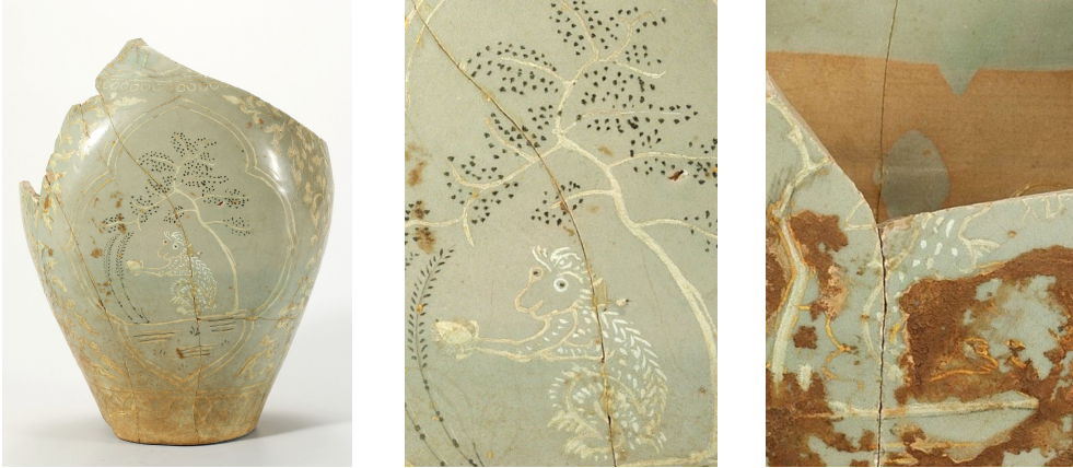
Fig. 9. <청자 상감원숭이토끼문 편호>, Celadon Flat Jar with Inlaid Monkey and Rabbit Design, H, 25.5cm, Excavated from Kaesŏng, National Museum of Korea

많고 특별한 원숭이로, 서왕모의 蟠桃와 太上老君의 金丹을 먹은 장생불사의 존재로 묘사된다. 19 여기 등장하는 나무도 일반적인 나무의 잎과 다르게 점을 찍어서 표현하였는데, 꽃이 핀 복숭아 나무를 묘사한 것이다. 따라서 편호의 원숭이를 ‘제후’로 해석하는 것 보다 반도원의 복숭아 나무 아래에서 반도를 들고 있는 장생불사의 원숭이로 해석하는 것이 훨씬 자연스럽다.