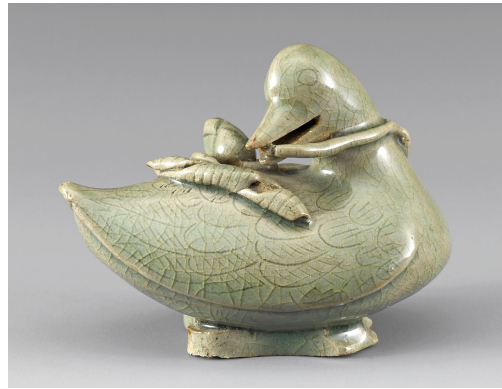
Fig. 10. <청자 오리형 향로> Celadon Duck-shaped Incense Burner, Koryŏ, H. 23.5cm, Excavated from Kaesŏng, National Museum of Korea