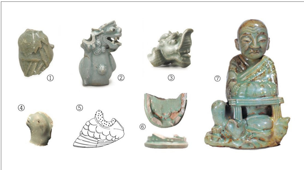
〈Table 2〉 강도의 상형청자 (①옥립리, ②월곡리, ③대산리, ④용정리, ⑤관청리, ⑥신문리, ⑦국화리) Sculpted Celadon at Kang-do (Koryŏ Celadon Shards Excavated from the ①Ongnim-ri, ②Wŏlgot-ri, ③Taesan-ri, ④Yongjŏng-ri, ⑤Kwanch'ŏng-ri, ⑥Simmun-ri, and ⑦ Kuk'wa-ri Sites, Koryŏ (Excavation Report of the Wŏlgot-ri, Ongnim-ri, Taesan-ri, Yongjŏng-ri, Kwanch'ŏng-ri, and Simmun-ri Sites, Kanghwa and Korea Heritage Service, https://www.khs.go.kr )

개경과 강도 상형청자의 주된 기종은 향로, 주자와 문방구류가 대다수를 차지하는데, 焚香과 飲酒, 玩賞 문화에서 주로 사용되는 기종들이다. 소재 면에서는 표형과 과형이 압도적으로 많고, 오리와 원숭이의 비중도 높다. 이러한 개경·강도 상형청자의 양상은 고려 상형청자의 전반적인 양상과 크게 다르지 않다. 25 강도 시기보다는 개경 시기에 상형청자가 다종다양하게 활발히 제작되어, 상형청자의 중심 시기가 강도 이전인 12세기~13세기 전반으로 파악된다. 하지만 강도 시기 유적에서도 비교적 양질의 상형청자가 출토되어, 상형청자가 지속적으로 제작되고 유통되었음을 알 수 있다(Table 2). 강도 시기에는 개경에서 거의 확인되지 않는 나한상 등의 종교 인물상이 확인된다는 점이 주목된다. 26 종교 인물상이 개경에서 거의 확인되지 않는 것은 현재 파악할 수 있는 자료의 한계나 유적의 성격에 따른 것일 수도 있지만, 나한상을