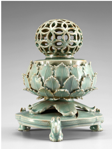
Fig. 5. <청자 투각칠보문 향로> Celadon Incense Burner with Openwork Seven Treasures Motif, Koryŏ, H. 15.3cm, Excavated from Kaesŏng, National Museum of Korea