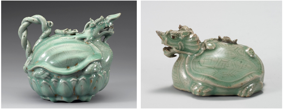
Fig. 12. <청자 귀룡형 주자> Celadon Ewer in the Shape of a Turtle-Dragon, Koryŏ, H. 17.3cm, National Museum of Korea