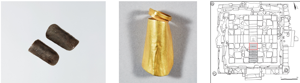
Fig. 10. <손톱 모양 장식> Nail-shaped Objects, 7th Century, Paekche, Silver, W. 1.5-1.6cm, Accession no. Iks 28, Iksan National Museum

체 크기가 서금당지 출토 토제나발의 절반도 되지 않는다(Fig. 9). 서금당지 출토 토제나발은 높이와 폭의 비율이 1:1이지만, 서탑 기단부 바닥석 출토 토제나발은 높이와 폭의 비율이 1:0.66이다. 49 크기만을 보아도 두 유물은 차이가 있고, 특히 출토 위치상 89점의 토제나발을 8점의 토제나발처럼 소조불상의 일부로 단정하기는 의문의 여지가 있다. 89점의 토제나발은 크기뿐만 아니라 모양도 조금씩 다르다. 이 토제나발은 원뿔의 외면에 나선으로 띠를 4~5번 정도 감아올렸고, 바닥은 대체로 편평하다. 부처의 사리를 봉안하는 탑이라는 종교적 공간에 이처럼 많은 수량의 토제나발을 매납한 것에는 처음부터 시주자의 어떤 의도와 바람이 있었을 것으로 생각된다.