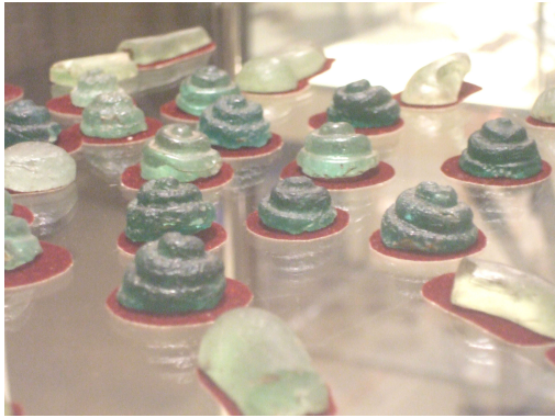
Fig. 1. <나발> Buddha's Spiral Hair, 5th to 6th Century, Glass, Jetavana Temple, Anudharapura, Sri Lanka

동남아시아의 미얀마에도 불발사리 신앙이 전승되었다. 팔리어로 부처의 일생과 본생담을 기록한 『니다나카타(Nidāna-Kathā)』에는 보드가야 인근에서 정각 이후 7주간의 부처 행적이 나온다. 부처가 마지막 주를 보내고 라자야타나(Rājāyatana) 나무 아래에서 계실 때, 타파사(Tapaṣa, 팔리어 Tapassu)와 발리카(Bhallika, 팔리어 Bhallika)라는 이름의 상인 형제를 만나 음식을 공양받고 불법을 전하였다. 두 사람은 부처의 첫 번째 제자가 되었고, 부처에게 청원하여 머리카락을 받은 후 고국으로 돌아와 탑을 세웠다. 14 미얀마 사람들은 이 두 상인이 자신들의 선조이며, 그들이 가져온 부처의 8개의 불발사리가 양곤의 쉐다곤 사원(Shwedagon Pagoda)에 모셔졌다고 믿는다. 15 또한 미얀마의 짜익티요 사원(Kyaikhthiyo Pagoda) 역시 부처의 불발사리와 불치사리가 모셔진 곳으로 알려져 있다. 전승에 따르면 부처의 6개의 불발사리가 미얀마에 전해졌는데, 그 중에서 3개의 불발사리가 현재의 황금바위 아래에 봉안되었다고 한다. 16