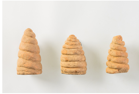
Fig. 5. <나발> Buddha's Spiral Hair, 7th Century, Paekche, Clay, H. 3.7-4.1cm, Accession no. Mir 1777, Iksan National Museum