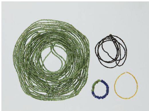
Fig. 4. <유리구슬> Glass Beads, 6th Century, Three Kingdoms Period, W. 0.1-0.2cm, Gwangju National Museum (Gwangju National Museum, Hamp'yōng Yedōk-ri Sindōk kobun: pimil ūi konggan, sumgyōjin yōlsoe , p. 73)

E. 가을 9월에 백제 성명왕이 전부 나솔 진모귀문, 호덕 기주기루, 물부 시덕 마가모 등을 보내어 부남의 보물과 노 2구를 바쳤다. 32