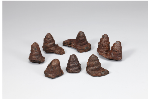
Fig. 7. <나발> Buddha's Spiral Hair, 6th Century, Silla, Bronze, W. 29.0cm, Accession no. Hwa 126, Gyeongju National Museum (National Museum of Korea, https://www.emuseum.go.kr )