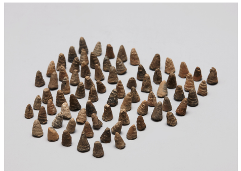
Fig. 9. <나발> Buddha's Spiral Hair, 7th Century, Paekche, Clay, H. 1.6cm, Accession no. Iks 14, Iksan National Museum (National Museum of Korea, https://www.emuseum.go.kr )

제작시기와 재질은 다르지만, 불상에서 떨어져 나온 나발의 예는 경주 황룡사지와 청주 흥덕사지 출토품에서도 확인된다. 경주 황룡사지 강당지 북쪽 건물터에서 출토된 청동나발의 지름은 최대 7.5cm이고, 높이는 최고 4.2cm에 이른다(Fig. 7). 머리 부분에 4개의 나발이 붙어있어 조성 당시부터 일체형으로 제작되었음을 알 수 있다. 청주 흥덕사지 출토 철제나발은 고려 때 제작된 것으로, 높이는 3.1~4.5cm이며 모두 7건 8점이다(Fig. 8). 이 중에는 나발과 머리 상부 일부가 붙어있는 예가 보이는