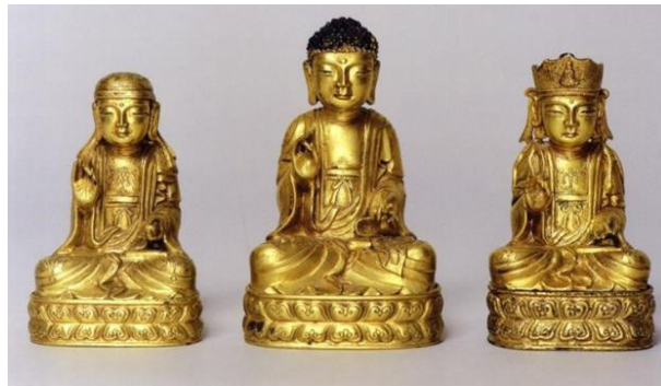
Fig. 14. <금동아미타삼존불좌상>, Kūmdongamit'asamjonbulch-wasang , Chosŏn 1429CE. P'yŏngyangyöksabangmulgwan

또한, <양주 회암사지 석조대좌>(Fig. 10)는 연화문이 장식된 상대와 하대가 연결된 형식으로 이 시기의 대좌에서 많이 나타난다. 양·북련 연화대좌를 갖춘 불상으로는 금강산 향로봉에서 출토된 <금동아미타삼존불좌상>(1429년, Fig. 14), 금강산 은정골 출토의 <금동아미타삼존불좌상>(1451년), <원각사탑 부조불상>(1467년), 순천 매곡동 삼층석탑 출토 <금동아미타삼존불좌상>(1468년), 남양주 수종사팔각오층석탑 1층 탑신석 안에서 발견된 <불보살상>(1493년) 등이 있다. 연판 형식은 조금씩 차이를 보이지만, 양련과 북련이 붙어 있는 이중연판대좌형식으로 15세기 조각에서 세트 구성된 예가 많이 나타난다. 이러한