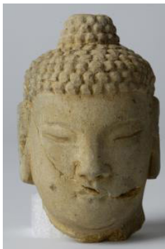
Fig. 1. 〈석조불상(머리)편 1〉 Sökchobultu, Hoeamsaji Ch'ult'o, Hoeamsajibangmulgwan

이 두 점의 석조불상 머리는 머리 위의 육계가 차이가 있지만 모두 정상계주가 있었던 둥근 홈을 가지고 있다. 이러한 홈은 불상 조각에서 정상계주를 엮을 때 14세기 이후 나타나는 형식이다. 이 두 점 외에도 회암사지 출토품 가운데 둥근 홈이 있는 육계 부분만 있는 파편도 확인되므로 머리 위로 높게 솟은 육계와 정상계주를 한 형식은 양주 회암사지 석조불상의 큰 특징이라 할 수 있다. 평면적인 얼굴이지만 생각에 잠긴 듯 부드러운 인상의 얼굴은 가름한 형과 두툼한 형이 모두 보이며, 상호는 양옆으로 올라간 눈썹 선과 가늘고 긴 눈을 얇은 음각선으로 간략히 표현했지만, 코끝 양쪽으로 둥글게 표현한 콧방울과 인중과