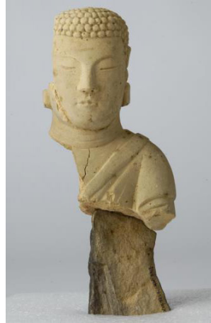
Fig. 3. 〈석조불상편 3〉 Sökchobulsangp'yön, Hoeamsaji Ch'ult'o, Hoeamsajibangmulgwan

〈석조불상(몸)편 5〉(Fig. 5)는 동방장지 동북쪽 석축 윗부분에서 복장공으로 추정되는 원형 흙이 가슴 부위까지 패어 있는 상체 부분만 출토되었다. 목에 뚜렷한 삼도가 있으며 대의를 걸친 통견의에 승각기가 일부 보이는 차림으로 옷주름이 매우 두텁게 표현되었다.