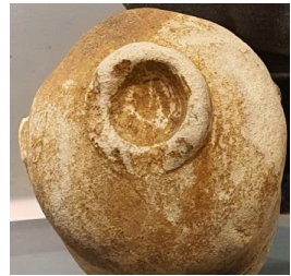
Fig. 2. 〈석조불상(머리)편 2〉 Sökchobultu, Hoeamsaji Ch'ult'o, Hoeamsajibangmulgwan