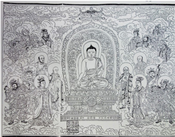
Fig. 19. <대수구다라니신주경> 변상, Illustration of the Mahāpratisarādhāraṇīsūtra , China, Myōng 1426CE.

이 경변상에 나타나는 머리형, 착의를 비롯하여 길상좌 아래로 펼쳐진 옷 주름선 등이 양주 회암사지 <석조불상 7·8>과 매우 유사하다. 이러한 도상 형식은 '태종 17년(1417)에 북경에 다녀온 사신 노귀산 등이 명 황제가 하사품으로 가져온 『제불여래보살명칭가곡(諸佛如來菩薩名稱歌曲)』(1417년, Fig. 20) 일백 본을 각종 사사(寺社), 각사(各司), 여러 경대부(卿大夫)의 집까지 여러 곳에 반포하였다' 45 는 기록과 세종 1년(1419) 12월 10~11일 실록에서 '명칭가곡을 외우는 소리가 천하에 퍼져 있고, 공화(空花)와 불상(佛像)의 상서를 그린 그림이 파다하여,……'와 '명칭가곡과 같은 책은 존송해야 하며, 승려들로 하여금 외우게 하여라' 46 라는 글 등을 통해서 중국의 경변상도 형식이 조선에서 확산하고, 불상의 조형에