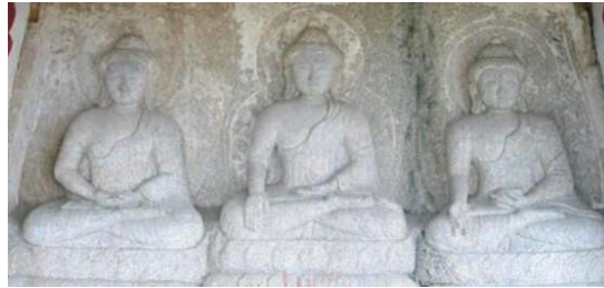
Fig. 17. <천주 벽소암 삼세불좌상>, Ch'önju pyöksoam sam-sebulchwasang , China, Yuan 1292CE. Ch'önju Pyöksoam

티베트계 조각 양식이 반영되어 중국 내륙에서 조성된 가장 빠른 작품은 항주 비래봉(飛來峰)의 조각이다. 중국을 통일한 원나라는 남송(南宋)의 수도였던 항주지역의 한족을 융합하기 위해 불교를 발전시켰고, 그 대표적인 성과가 비래봉 석각이다. 항주 비래봉에서 원대에 조성된 조각은 1282~1292년에 제작된 것으로 13세기 티베트계 원 조각의 기준 양식이다. 또, 강남지역에서 가장 시기가 내려오는 티베트계 삼세불 <천주 벽소암(碧霄岩) 삼세불좌상> (1292년, Fig. 17)은 원대 천주로감림관(泉州路監臨官)이었던 당오씨(唐吾氏=서하인) 장군 아사(阿沙)가 청원산에 올라서 청량산의 기세에 감탄하여 조성한 것으로 전해진다.