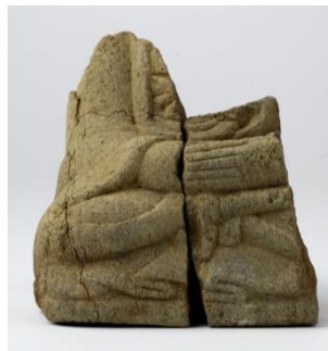
Fig. 8. 〈석조불상편 8〉, Sökchobulsangp'yön, Hoeamsaji Ch'ult'o, Hoeamsajibangmulgwan