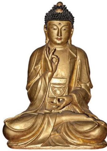
Fig. 13. 〈영주 흑석사 목조아미타여래좌상〉, Yŏngju hŭksŏksa mokchoam-it'ayŏraejwasang , Chosŏn 1458CE. Yŏngju hŭksŏksa

〈영주 흑석사 목조아미타여래좌상〉(Fig. 13)의 법의 왼쪽에서 고려 후기부터 보이는 Ω형의 옷 주름을 볼 수 있다. 그런데, 정상계주와 Ω형의 옷주름이 함께 표현된 것은 〈경주 왕룡사원 목조아미타여래좌상〉, 〈천주사 목조아미타여래좌상〉 등 이 시기의 특징이다. 이들 불상 조각 얼굴의 선정에 든 명상에 잠긴 모습에 정상계주를 한 형식은 비록 석조와 목조라는 차이는 있지만, 매우 유사한 것으로 조선 초의 조각 양식 특징으로 볼 수 있다. 또한 〈석조불상(품) 편 6〉(Fig. 6)에서 나타난 왼쪽 옷깃의 접힌 옷 주름도 이들 상에서 확인되는 조선 전기 불상에서 나타나는 특징적인 옷 주름선이다. 이와 같은 회암사지 석조불상의 형식 특징은 조선 전기 기년작 불상들과 석조와 목조라는 차이는 있지만, 매우 유사한 조선 15세기 조각 양식의 특징을 공유하고 있다.