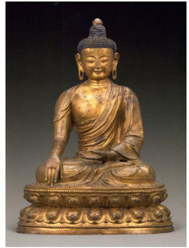
Fig. 15. <석가여래좌상>, Sökkayöraejwasang , China. Myōng 1450CE. Beijing Capital Museum

이 불상이 조성된 대리국은 중국 남쪽 지역 교통의 중요한 요충지로 송(宋)과 동남아시아의 티베트 문화가 모이는 입지 특성으로 다른 지역 문화가 융합된 조형 특징이 발전하였다. 34 특히, 토번이 멸망한 후 분권국가였던 남조·대리국 시절에 조성된 대리의 숭성사(崇聖寺) 천수탑(千尋塔)에서 출토된 운남성 박물관 소장의 <금동불좌상> 등에도 둥근 얼굴형에 반원형의 중앙계주와 정상계주의 표현이 나타난다.