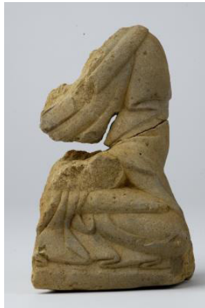
Fig. 4. 〈석조불상(몸)편 4〉, Sökchobulsangp'yön, Hoeamsaji Ch'ult'o, Hoeamsajibangmulgwan