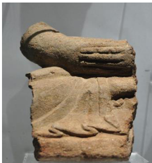
Fig. 7. 〈석조불상편 7〉, Sökchobulsangp'yön, Hoeamsaji Ch'ult'o, Hoeamsajibangmulgwan