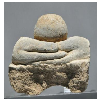
Fig. 9. 〈석조불상편 9〉, Sökchobulsangp'yön, Hoeamsaji Ch'ult'o, Hoeamsajibangmulgwan