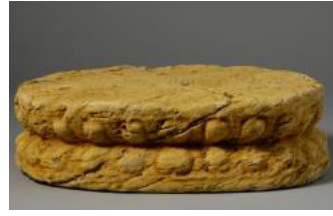
Fig. 10. <석조대좌>, Sökchodaejwa, Hoeamsaji Ch'ult'o, Hoeamsajibang-mulgwan

보광전지 남서쪽 기단 밖에서 출토되었다. 너비 24cm의 크기로 고정을 위해 두 개의 구멍이 뚫려 있다. 이러한 대좌는 고려 시대까지 사용되던 상·중·하대의 수미대좌에서 중대부분이 사라지고, 여말선초 조각에서부터 상대와 하대에 표현된 연꽃이 서로 앞을 맞대고 있는 형식이다.