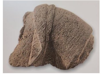
Fig. 6. 〈석조불상(몸)편 6〉, Sökchobulsangp'yön, Hoeamsaji Ch'ult'o, Hoeamsajibangmulgwan

회암사지 출토 〈석조대좌〉(Fig. 10) 양련과 복련이 맞붙은 형태의 사암제 대좌로 6단지