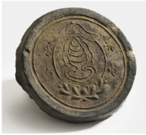
Fig. 11. <불정심인 수막새>, Pulchöngshimin sumaksae, Hoeamsaji Ch'ult'o, Hoeamsajibangmulgwan