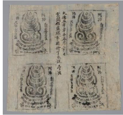
Fig. 12. <아미타삼존다라니>, Amit'asamjon tarani, Korea 1301CE. Mun'gyöng Taesüngsa

도상이며, 회암사에서 출토된 <육자진언범자문 암막새>에서 육자진언의 자획, 필법 등이 <남양주 봉선사 동종>(1469년), <남양주 수종사 동종>(1469년)에 새겨진 육자진언과 유사하므로 회암사지출토 기와는 15세기에 제작된 것으로 추정된다는 연구 성과가 있다. 20