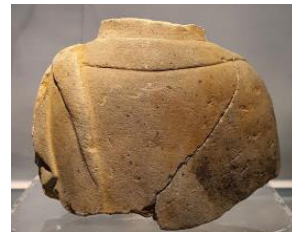
Fig. 5. 〈석조불상(몸)편 5〉 Sökchobulsangp'yön, Hoeamsaji Ch'ult'o, Hoeamsajibangmulgwan