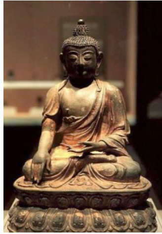
Fig. 18. <석가여래좌상>, Sōkkayōrae-jwasang , China, Myōng 1478CE. Beijing Capital Museum

(諸佛菩薩妙相名號經咒)』, 고궁박물관에 소장된 『명내부 금강호심경(明內府金藏護心經)』 변상도 등 이 시기의 많은 경변상도를 통해 부처의 형상에 대한 기준을 볼 수 있다. 43 이 변상도에서 보이는 도상형식은 티베트 조각과 완벽히 부합되지 않지만, 네팔과 티베트식이 결합한 ‘범상(梵像)’으로 지칭되는 공통 요소를 볼 수 있다. 그리고, 이러한 형식에 네모형 얼굴과 긴장한 어깨선을 한 네모진 형태의 전통적인 조각이 융합된 특징이 명 영락·선덕기 조각에서 공존한다. 이러한 형식은 뉴욕 메트로폴리탄 박물관 소장의 <건칠석가여래좌상>(1411년 추정, Fig. 29)에서 보이며, 북경 수도박물관 소장의 <석가여래좌상>(1478년, Fig. 18) 등에서 티베트 조각 양식이 중국 전통 조각 양식으로 변화된 형식을 볼 수 있다. 이후, 명 가정기(嘉靖期, 1522~1566)에 도교를 숭상하게 되면서 티베트계 양식은 점차 한전양식으로 변화가 더욱 진행되었다.