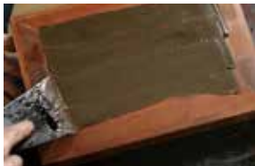
도1 백골 흠 메우기

칠기 제작과정에서 골회는 옷칠과 혼합하여 器面위에 자개 등의 장식재를 부착하기 전 후 쓰인다. 골회는 나무 백골의 흠이나 기물의 뒤틀림을 방지하기 위해 감싼 布面을 고르게 덮고(도 1, 2), 기면을 장식할 수 있도록 매끄러운 바탕층을 만들며 나전 장식을 잡아주는 역할을 한다(도 3). 한국 칠기의 바탕층을 형성하는데 소용되었던 재료들은 출토칠기 및 전세칠기의 과학적 분석연구 자료를 통해 옷칠과 혼합된 골분, 토분, 목탄분 등이 있었음을 파악할 수 있다(표 1). 칠기의 제작에 골회가 사용된 역사는 원주 법천리 백제고분, 익산 미륵사지, 경주 방내리 고분 출토 칠기의 칠층 성분 분석에서 갈슈과 인의 검출로 삼국시대부터 확인된다. 4 현재까지 축적된 분석 사례로 칠기의 바탕층 형성에 토분이 대부분 혼합하여 활용되었고, 골회의 용례가 조선시대로 갈수록 용례가 많아진 점이 관찰된다. 골회는 옷칠과 혼합되어 바탕층(漆層)을 형성하는 여러 가지 재료 중 하나이지만, 골회(骨灰)를 사용하지 않아도 칠기의 바탕층을 형성하는 작업 단계를 골회로 지칭하여 서술된 연구 자료가 많이 있다. 본 논문에서의 ‘골회’는 칠기 제작에서 옷칠과 혼합되어 바탕층(漆層)을 형성하는 단일 재료(뼈를 태운 재)에 한정하여 다루고자 한다.