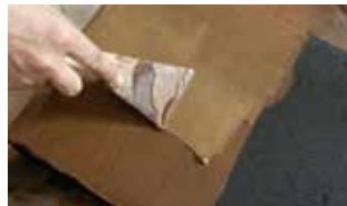
도2 베(布) 눈 메우기