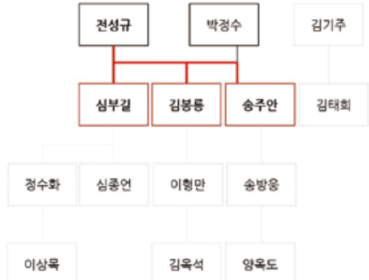
도 20 무형문화재 나전장 및 칠장 사승 관계도