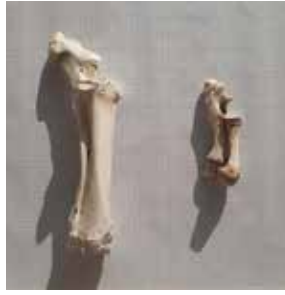
도 6 (左) 소 전완골, 척골, W: 37.5, D: 13.9, H: 8.8cm (右) 돼지 전완골, W: 13.5, D: 4.4, H: 2.9cm

에서는 가루로 된 재료에 대하여 ‘말(末)’과 ‘회(灰)’로 구분하여 기록한다. 분말 상태의 재료를 膠末, 太末, 眞末 등으로 기술하고, 소성을 거친 것은 石灰, 蒿灰, 炭灰로 적혀있다. 제작기술적 관점에서도 소성하지 않은 소의 뼈는 5일 이상 끓여도 기름이 배출될 정도로 유분이 과다하기 때문에 소성하지 않고 가루를 내어 옷칠