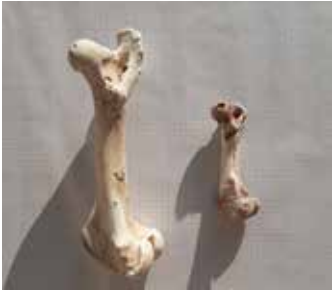
도 5 (左) 소 대퇴골, W: D: 13.1, H: 12.9cm (右) 돼지 대퇴골, W: 19.6, D: 7, H: 6cm