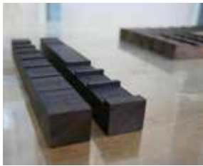
도 17 시험판 제작 W: 30mm, D: 30mm, H: 0.5, 1, 1.5, 2, 2.5, 3, 3.5, 4, 4.5, 5mm

경화속도를 비교한 결과(표 6), 0.5~1mm깊이 시험판에 균분한 시료 가운데 토분과 옷을 혼합한 C시료가 6시간 내 경화되었고, A, B, D 시편의 0.5~1mm 깊이 시료가 12시간 내 굳어졌다. 표면 균열도 관찰 결과(표 6), A, B시료가 0.5~2mm 깊이에서는 균열없이 경화하였고, 3mm 깊이부터 표면균열이 일어났으며, C시료는 가장 얇은 0.5mm 깊이에서부터, D시료는 2mm부터 표면 균열이 나타났다(도 18). C시료는 A, B, D시료보다 경화속도가 빨랐으나, 경화되는 속도가 빠를수록 표면균열이 커지는 결과가 도출되었다(도 19). 경화 실험을 통해 바탕 칠층을 두껍게 올렸을 때 균열없는 기면(器面)이 형성 가능한 재료의 우선순은 골회 및 탄분, 다음으로 토분과 풀, 마지막으로 토분과 옷을 혼합한 순서로 확인되었다.