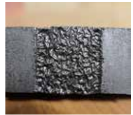
도 19 표면균열이 일어난 C 시료