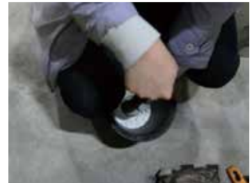
도 10 곱회를 쇠절구로 뺏아서 제분

연마도 실험은 A, B, C, D 시료를 각각의 비율로 혼합하고, 가로세로 30mm×30mm와 깊이 2mm 크기로 제작한 시험판에 균분하였다(도 11, 12). 시험판의 시료가 완전히 경화 된 후 수분을 머금은 #800 숫돌로 동일한 하중을 가하여 30회 왕복 연마하였다(도 13, 14). 연마한 각 시료의 모서리 4곳의 연마된 깊이를 측정하고 평균 내어 비교하였다(도 15, 16)(표 5).