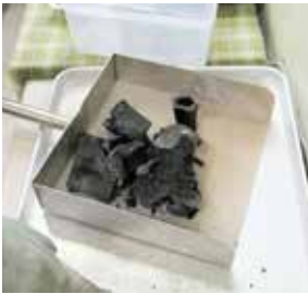
도 7 400-500℃ 소성한골회

과 섞으면 칠의 경화에 지장을 준다. 유분이 많으면 재료 자체의 탄성이 높아서 뼈를 제분하기 어려울 뿐만 아니라, 습기가 조성되면 구더기가 증식하여서 소성하지 않은 뼈는 관리하기에 까다롭다. 더하여 골회를 만들기 위한 소성 온도는 800℃ 이상으로 생각된다. 칠기 유물의 바탕 칠층을 관찰한 기존 연구에서 골회의 색상을 유백색으로 분석하였다. 소 뼈는 소성을 시작하면 검정색으로 그을려졌다가 500℃를 지나면 점점 회색을 띄고(도 7), 800℃ 이상에서 백색이 나타나고 1000℃가 넘어야 유기물이 제거된다(도 8). 이와 같은 요인으로 칠기 제작에 소용된 골회는 800℃ 이상 소성한 소뼈의 재료 판단된다.