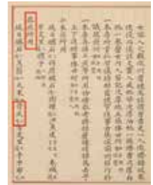
도 9 『英祖貞純王后 嘉禮都監儀軌』, 一 房儀軌-己卯五月日

『영조정순왕후가례도감의궤』, 일방 의궤(一房儀軌), 건륭 24년 기묘(1759, 영조35) 6월