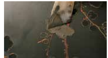
도3 자개 단층면 메우기