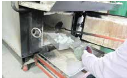
도 8 1000℃ 소성한골회

골회가 漆器의 제작에 쓰였던 사실도 문헌에서 확인할 수 있다. 도감에서 의례용 상과 함의 ‘着漆’에 골회가 소용된다 하였고, 도감이 ‘휴칠(髹漆: 옷칠)’할 때 골회를 사용하기 위해 현