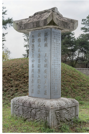
도 1 <명안공주 묘갈>, 1688년, 높이 244.5cm, 안산시

오탈아와 관련된 묘비 중 가장 빠른 것은 부인인 <明安公主 墓碣>(1688)이다(도 1). 숙종이 명안공주와 오탈아를 아꼈던 만큼 명안공주가 1687년 서거하자 장례에 정성을 다했다. 숙종은 명안공주의 喪次에 舉動하고 47 , 棺, 漆, 祭需 등을 지급하거나 48 , 墓所를 풍수로 이름난 李嶠로 하여금 정하게 했다. 49 더불어 석물은 신하들의 반대에도 불구하고 江華島에서 채취해 제작하게 했으며, 50 이듬해 <명안공주 묘갈>을 건립할 때는 曳運軍 등을 파견해 돕기도 했다. 51