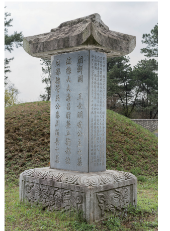
도 2 <오두홍 묘갈>, 1703년, 높이 285cm, 안산시

이 작품들에 새겨진 글자와 <대자천자문>의 글자 크기와 형태를 비교하면 이 작품들이 집자비라는 것을 알 수 있다. 59 가장 먼저 건립된 <오두홍 묘갈>과 <대자천자문>의 글