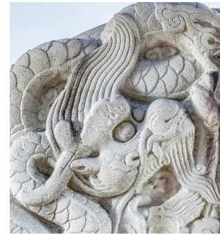
도 14 <김좌명 신도비> 이수 뒷면 용두 부분, 1679년, 남양주시, 김민규 촬영

아마도 오테주의 사회적 신분, 경제력 등으로 화려하고 창의적인 작품을 당시 최고의 장인에게 제작시킬 수 있었다고 생각한다.