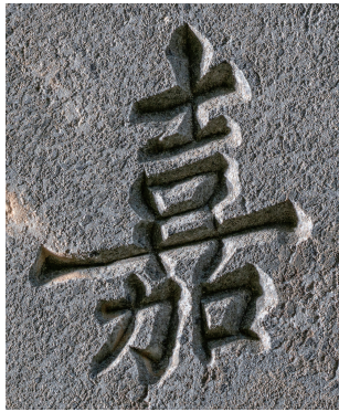
도3 <오두홍 묘갈>의 '嘉', 높이 15cm