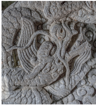
도 12 <오정방 묘비> 이수 뒷면 용두 부분, 1698년, 안성시