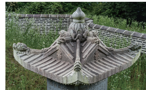
도 15 <상주황씨 묘갈>의 개석, 1705년, 안산시

<상주황씨 묘갈> 개석 하단에는 추녀마루, 서까래와 부연이 조각되어 있고 비신과 닿는 부분은 栱包가 조각되어 있다. 공포는 각 면에 4개씩 조각되어 있으며, 그 사이에는 包壁을 새겼