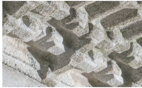
도 18 <명빈박씨 묘표> 개석 하단의 공포, 1703년, 예산군