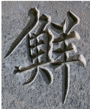
도5 <오두홍 묘갈>의 '鮮' 자, 1703년