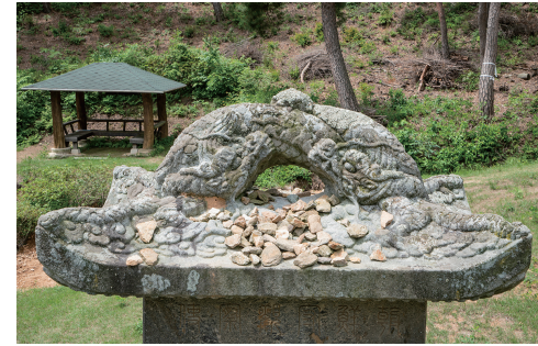
도10 <오숙 묘비>의 용뉴형개석, 1703년 4월, 안성시