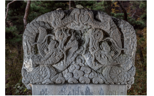
도11 <오정방 묘비> 이수 뒷면, 1698년, 안성시

해주오씨 가문의 용뉴형개석과 반룡형개석의 특징은 동일한 자세가 없다는 것이다. 먼저 용뉴형개석 3점을 비교해보면 가장 먼저 건립된 <오상 묘갈>(도 9)은 두 마리의 용이 용뉴처럼 엉켜있으며 머리는 개석 좌우측에 하늘을 바라보고 있는 형태이다. 용뉴 중앙에는 如意珠가 조각되어 있다.