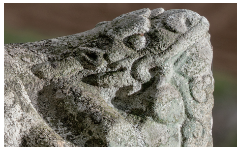
도 20 <명빈박씨 묘표> 개석 상단의 용두, 1703년, 예산군, 김민규 촬영

다. 공포에 조각된 첨차는 측면이 뚫려 있는데(도 17), 공포가 조각된 조선시대 비석 개석은 총 18기로 이중 이러한 작품은 오테주가 건립한<상주황씨 묘갈>과<오두인 묘표>(1715) 뿐이다. 76