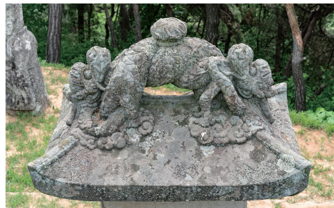
도9 <오상 묘갈>의 용뉴형개석, 1690년, 안성시

용뉴형개석은 15세기 梵鐘의 龍鈕 형태를 모방해 만든 개석형태로 <道岬寺 道洗國師守眉碑>(1653)에서 최초로 만들어졌다. 70 이 용뉴형개석은 조선시대에 총 11기가 건립되었으며, 이 중 오탁주는 안성 해주오씨 선영에 위치한 <吳翔墓碣>(1690), <오두홍 묘갈>(1703), <吳翻 墓碑>(1703) 등 3기를 건립했다. 같은 묘역에 있는 <오두인신도비>(1701)는 이와 유사한 盤龍形蓋石이다. 71