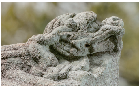
도 19 <상주황씨 묘갈> 개석 상단의 용두, 1705년, 안성시, 김민규 촬영