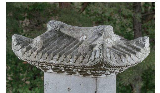
도 16 <명빈박씨 묘표>의 개석, 1703년, 예산군