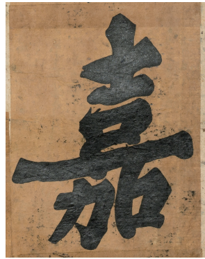
도4 <대자천자문>의 '嘉', 높이 15cm, 화정박물관 소장