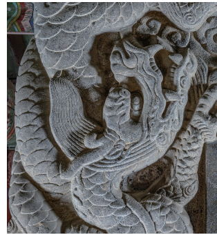
도 13 <태종 현릉 신도비> 이수 앞면 용두 부분, 1695년, 서울시