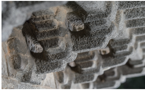
도 17 <상주황씨 묘갈> 개석 하단의 공포, 1705년, 안성시, 김민규 촬영