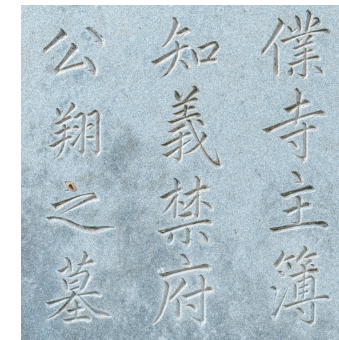
도7 오태주書, 오상 묘갈 전면자 부분, 1690년 건립, 1699년 개수

오태주도 자신이 잘 썼던 송설체로 비석의 前面에 큰 글자로 새기는 것 보다, '기세가 웅장하고 강건'한 <대자천자문>을 집자해 새기는 것이 더 낫다고 생각했던 것으로 짐작된다. 오태주가 송설체로 전면자를 크게 쓴 <오상 묘갈>(도 7)과 한호 집자비인 <오두인 묘표>(도 8)의 글자를 비교하면 송설체는 字形이 아름답지만 한호 대자에 비해 氣勢가 부족함을 느낄 수 있다. 유명한 서예가