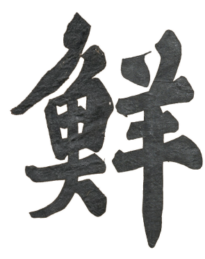
도6 <大字千字文>의 '鱗'과 '祥' 을 조합, 김민규 편집

자는 字形뿐만 아니라 크기도 거의 같다. 그중에 '嘉'자는 높이가 15cm로 <오두홍 묘갈>과 <대자천자문>이 동일하며 字形, 획의 특징 등이 같다(도 3, 4). 따라서 <오두홍 묘갈>은 현재까지 조사된 한호 집자비 가운데 가장 이른 작품이라고 할 수 있다(표 5).