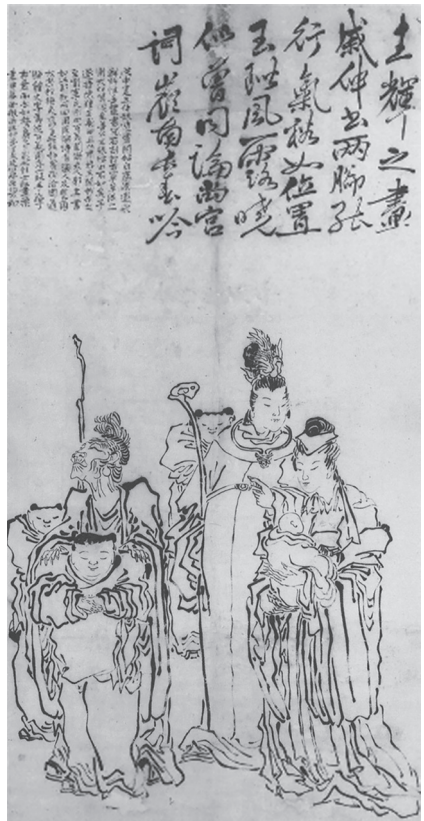
도 13 소인산, 〈人物〉, 1848, 廣州美術館

여성 중심의 이상사회를 시각적으로 가장 잘 표현한 〈百職圖〉는 다수의 여성을 2m가 넘는 긴 화폭에 그려 〈한궁춘효도〉 스타일의 전통적인 미인 그림을 연상시킨다(도 14). 그러나 다양한 연령대와 신분을 가진 인물들이 각자 자신들의 일에 집중하는 모습을 동적이고 세밀하게 묘사하여 유학자 집단을 그린 〈香壇百賢圖〉의 정적이고 단순한