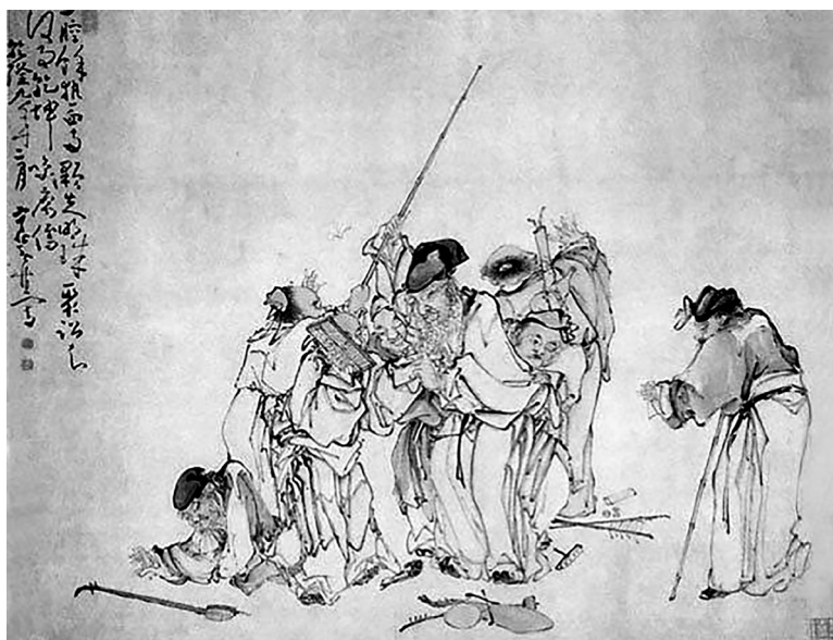
도 1 황신, 〈群盲聚訟圖〉, 1744, 蘇州博物館

적으로 드러냈다. 특히 황신의 〈群盲聚訟圖〉는 앞서 언급한 주신과 전 오위가 그린 걸인 도상이 어떠한 방식으로 이어졌는지를 보여주는 주요한 작품으로 이후 살펴볼 소유봉의 그림과도 연관성을 갖는다(도 1). 황신은 걸인 중에서도 맹인들을 선택해 특유의 草書 필치로 싸움에 집중한 맹인들을 그렸다. 제발에는