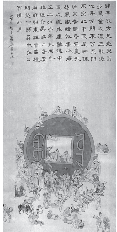
도 10 소육봉, 〈通寶圖〉, 廣東省博物館

“넉 사(四)자처럼 생긴 네모난 구멍을 가진 녀석, 나이는 노인부터 나이 얼마 되지 않은 어린아이, 세상 모든 종교가와 학자마저도 이놈에 농락당하는구나. 관직에 있는 몸은 공정하지 못 하게 되고, 불문에 있는 중은 마음을 비우지 못 하게 되네. 이 그림의 돈 안이 바로 신선 동굴이로구나. 구린 황동향이 콧구멍을 뿜 뚫고 지나가면, 마음은 시커멓게 변하고 눈동자는 핏발이 서서 빨개진다네. 그 해악이 몸을 마비되게 하고, 정신을 미치게 만들고 말지. 엽전의 바깥에서는 엽전의 네모난 안으로 들어가기 어려우니, 집집마다 엽전이 좀 적으면 창피해 하고, 엽전이 좀 많으면 통하기 어렵다네. 겨울에는 돈으로 따뜻하게 지내야 하고, 봄에는 돈을 사용해야 하는데, 능력 있는 물주는 온갖 돈을 굴리지만 돈 없는 일반 백성들은 답답해 죽게 될 뿐이라네.” 23 (밑줄은 필자)