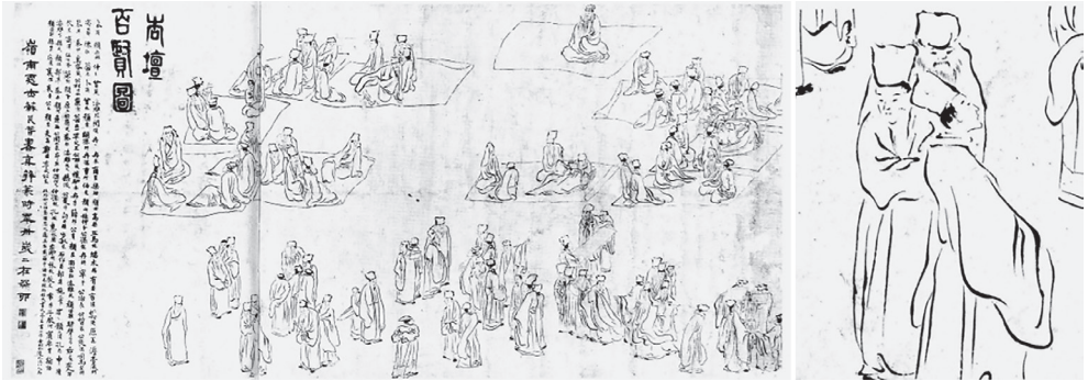
도 15 소인산, 〈杏壇百賢圖〉, 1843, 香港中文大學文物館

인물 묘사와는 대조를 이룬다(도 15). 26 소인산의 이상사회는 현실에 대한 강한 불만이 강렬하고 압축적인 방식으로 시각화된 것이며 이야기를 풀어내는 방식이 상당히 수준 높다. 소인산의 이러한 접근법은 자신의 삶을 적극적으로 개척해 나가는 인물을 그린 풍자소설, 이여진의 『鏡花緣』과도 유사해 보인다.