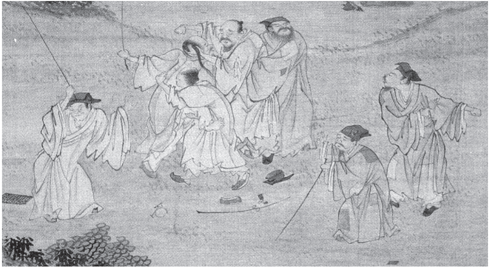
도 2 작자미상, 《風俗人物圖冊》, 7면 부분, 臺北故宮博物院

소육붕과 소인산의 사회비판적 회화는 급변했던 광저우의 사회, 경제적인 분위기와 그로 인한 화단의 변화 및 꾸준히 명맥을 이어온 사회비판적 회화사 속에서 창작된 산물이다. 표현 방식은 양주화파 화가들과 유사하지만, 그들이 강하게 담지 못했던 사회 비판적 의식을 제발을 활용해 개성을 살리면서 표현했다.