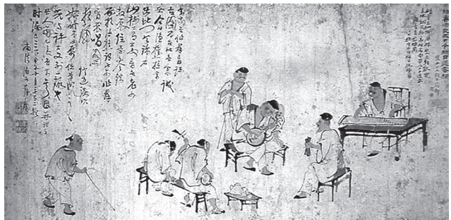
도 5 소옥봉, 《群盲評古圖》, 1834이전, 廣東省博物館