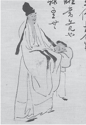
도 3 소인산, 〈自畫像〉, 1842, 廣州美術館

이 되기를 바라던 부모와 큰 갈등을 겪는다. 이 갈등은 일반적인父子간의 갈등을 넘어선 것으로 보인다. 아버지가 소인산을 관아에 고발하여 투옥시켰다고 전하며 얼마 지나지 않아 37세의 나이로 감옥에서 생을 마감하기 때문이다. 더 이상의 구체적인 내용은 알 수 없으나 과거 시험에서 낙방 후 그가 남긴 반유교적이고 청 황실을 비판하는 서화들로 미루어 보면, 평소 '어긋난 사고와 행동'으로 가문을 위협했을 가능성도 있다. 결혼은 했지만 자식이 없었고 아버지와의 관계 악화로 답답하고 외로웠을 심정을 반영하듯, 그의 그림은 白描의 거친 필선을 과감하게 사용하여 표현주의적인 작품이 다수 전한다.