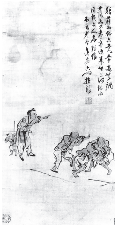
도 7 소옥봉, 〈盲人打鬪圖〉, 1856, 廣州美術館

라고 했다. 이로 보아 당시 통용되던 ‘군맹평고도’를 묘사한 것으로 보인다. 게다가 〈군맹취창도〉 제발에는 〈군맹평고도〉를 제작한 이유로 ‘세태를 비판하기 위함’이라고 적었다. 알면서도 모르는 척하여 세상 사람들을 속이고 명예를 흠치는 것을 규탄하여 세태를 비꼰 것이다. 〈군맹취창도〉는 앞서 그린 〈군맹평고도〉가 비판을 받자 맹인들을 직접 관찰하여 새로 그린 그림으로, 이후에는 비난받지 않았다고 한다(도 6). 12 당시 사람들이 가한 비판의 구체적인 내용과 이유에 대해서는 알 수 없지만 아마도 맹인이 골동품을 감상하는 것보다 합주를 하는 모습이 좀 더 비현실적으로 인식되어 사회를 비판하고자 한 취지에 부합한다고 여겨진 듯하다.