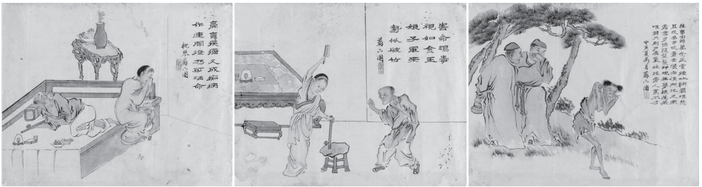
도 4 소육붕, 《戒煙圖冊》, 1854, 香港藝術館

소육붕이 그림을 판매하면서 시대 분위기를 회화에 반영했던 것과는 달리 소인산은 한 개인의 성장 과정과 가정의 불화에서 비롯된 사회에 대한 불만이 회화에 고스란히 투영된 것으로 보인다.