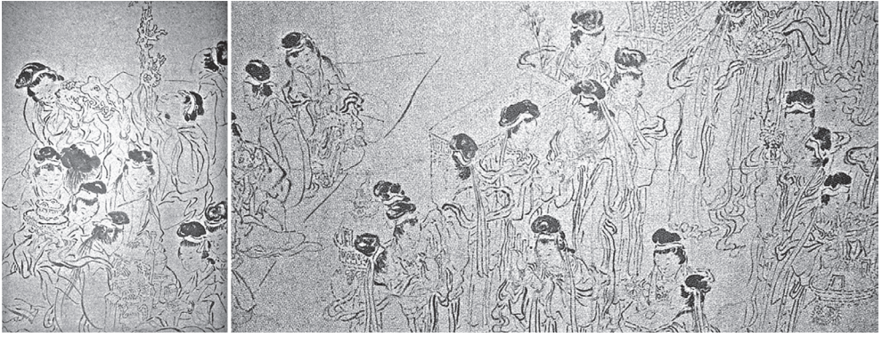
도 14 소인산, 〈百職圖〉, 부분, 廣州藝術博物館