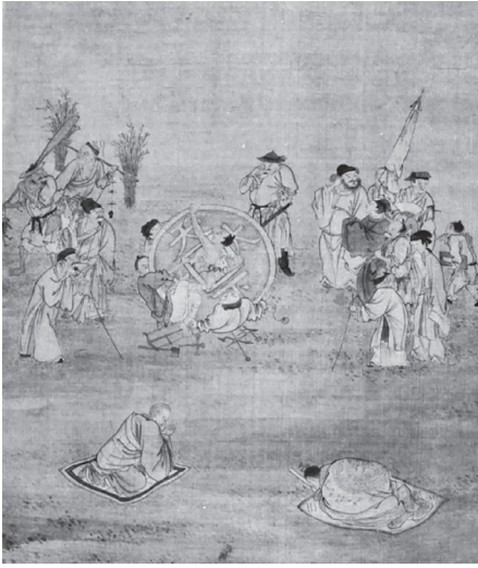
도 11 작자미상, 《風俗人物圖冊》, 7면, 臺北故宮博物院