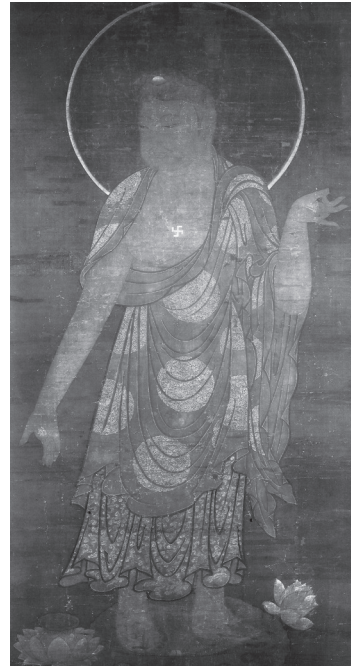
도 19 〈阿彌陀如來圖〉, 高麗 1286년, 비단에 채색, 203.5×105.1cm, 일본 도쿄 시마쓰가(島津家) 구소장

삼성미술관 Leeum 소장의 〈아미타내영도〉는 고려 후기 아미타불도의 유형 중 왕생자가 표현된 매우 이례적인 예이다. 이와 마찬가지로 일본 시마쓰가 구소장본인 1286년 〈아미타불도〉(도 19) 왕생자는 아니지만 아미타불의 오른발 옆에 연꽃이 표현되고, 몸을 살짝 돌린 자세를 취하고 있어 희귀한 도상으로 연구자들의 관심의 대상이 되고 있다. 더구나 화기에 조성연대와 발원지, 그리고 『화엄경』, 『보현행원품』의 경설에 근거한 정토왕생관까지 적혀있어 논란의 여지가 많다. 56 이 불화에 관해서는 한정된 지면에 서술하기 어려우므로 아미타팔대보살도와 지장보살이 포함된 아미타삼존도 등과 함께 차후의 과제로 남겨두고자 한다.