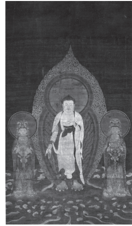
도 14 〈아미타삼존도〉, 남송 13~14세기, 비단에 채색, 102.8×57.4cm, 일본 교토 젠린지(禪林寺)

16묘관수행이 사찰에서 행해졌다는 사실은 사명지례의 법손인 介然이 延慶寺에 16觀堂을 창건하였던 사실과 35 항주 上天竺寺에도 16관당이 건립되었다는 사실에서 알 수 있다. 36 그 결과 영파 주변에서는 唐代의 〈관경변상도〉와는(도 5) 전혀 다른 구성과 도상을 가진 〈16관변상도〉가 창출되었다(도 7, 11). 37 당대의 16관변상도는 아미타정토도의 주변에 배치되어 부수적이고 설명적인 느낌이 강하였다. 반면 송대 이후에는 중앙의 아미타정토도가 빠지고 〈16관변상도〉만을 독립적으로 제작하여 수행을 위한 불화로 따로 제작하였음을 알 수 있다. 이 때 9품왕생장면은 내영장면이 아닌 왕생 이후에 극락정토에서 왕생자가 아미타설법을 듣고 있는 장면으로 변화되었다. 〈16관변상도〉에서 내영장면이 사라진 상황에서 새롭게 창출된 입상의 아미타불도상은 어디에서 찾을 수 있을지 살펴보겠다.