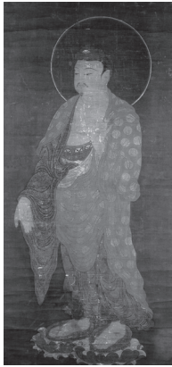
도 1 <阿彌陀佛圖>, 고麗 14세기, 비단에 채색, 185.0×86.5cm, 일본 교토 쇼보지(正法寺)