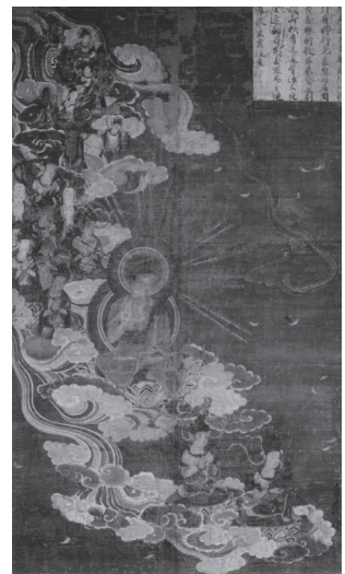
도 9 <아미타내영도>, 가마쿠라 14세기, 일본 교토 산젠인(三千院)