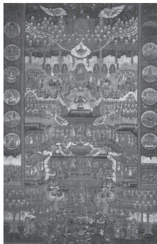
도 7 <관경16관변상도>, 高麗 14세기 전반, 비단에 채색, 150.5×113.2cm, 일본 후쿠이현 사이후쿠지(西福寺)