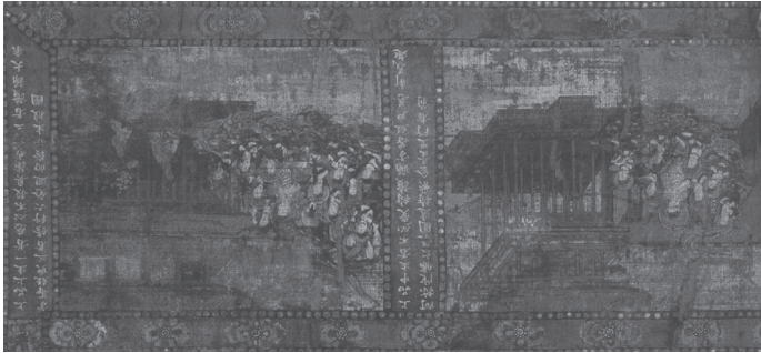
도 10 구품왕생장면 중 상품상생, 〈다이아만다라〉, 무로마찌 1505년, 일본 나라 다이마테라(當麻寺)

기 위한 회화적 장치로, 중국 당대 〈16관변상도〉의 구품왕생장면에 표현된 내영장면에서부터 보인다(도 6). 일본에서 발생한 아미타내영도상이 당대 〈16관변상도〉의 9품왕생장면의 영향을 받았던 것은 8세기 중반경 당나라의 정토도가 일본 나라의 다이마테라에 전래되었기 때문일 것이다. 17 헤이안말기~가마쿠라시대에 호넨(法然, 1133~1212)이 개창한 정토종이 융성함에 따라 8세기 중엽 경에 전래되었던 綴織의 〈다이아만다라〉를 모본으로 수많은 만다라가 조성되었다. 이 중 1505년에 제작된 다이마테라 소장의 만다라에 그려진 상품상생 장면을 보면(도 10) 일본 내영도상의 성립에 미친 영향이 명확히 보인다.