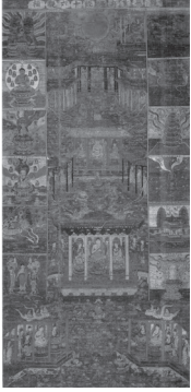
도 11 <觀經十六觀變相圖>, 가마쿠라 13세기, 비단에 채색, 128,5×61,5cm, 일본 나라 아미다지(阿彌陀寺)