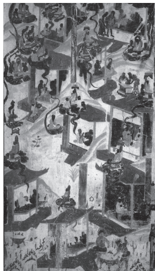
도 6 <관경16관변상도> 중 九品往生 장면, 盛唐, 敦煌 215굴

이제까지 살펴보았듯이 당대 <16관변상도>의 9품장면은 시간적으로 왕생 이전이고 공간적으로 사바세계인 반면 13세기 이후의 <16관변상도>에서는 왕생 이후의 극락세계를 배경으로 한다는 것을 알 수 있다. 이처럼 <16관변상도>에서 9품왕생장면이 변화하였다는 것은 동아시아 삼국의 정토왕생사상과 신앙의 변화를 반영하는 것으로 앞으로 전개될 아미타불입상의 도상을 이해하는데 매우 중요한 개념을 제공할 것이다.