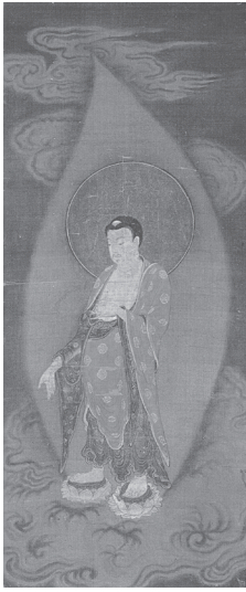
도 15 <아미타불도>, 남송, 일본 후쿠이현 사이후쿠지(西福寺)