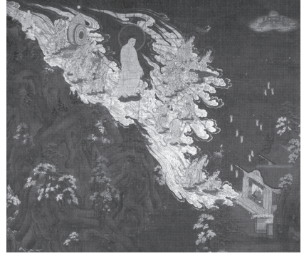
도 13 <아미타25보살내영도>, 가마쿠라 14세기, 일본 교토 지온인(知恩院)

라 도다이지(東大寺)를 중심으로 南道佛敎를 부흥시켰던 인물이다. 20 그는 송에서 아미타삼존도와 21 관경변상도 등을 수입하였다고 전한다. 22 실제로 나라의 아미다지(阿彌陀寺)에 전하는 <16관변상도>와 (도 11) 23 교토의 조토지(淨土寺) 아미타불입상은 남송의 작품을 모본으로 제작된 것이다(도 12). 24 초젠이 영파 지역에서 가져온 작품들은 송의 아미타불도상을 일본의 아미타내영도상에 이식하였다는 점에서 의미가 있다.