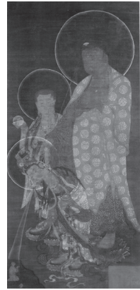
도 4 <아미타삼존내영도>, 고려 14세기 중반, 비단에 채색, 110.0×51.0cm, 삼성미술관Leeum

‘내영’은 임종에 가까운 왕생자를 위하여 아미타불이 극락에서 인간세계로 내려와 왕생자를 맞이한다는 의미를 갖기 때문에 아미타내영도상에는 왕생자를 동반하는 경우가 많다. 그런데 고려 입상의 아미타불화 중에는 왕생자를 표현한 예가 삼성미술관 Leeum소장의 <아미타삼존내영도>가 유일하다(도 4). 대부분의 다른 아미타불화에는 왕생자가 없음에도 불구하고 Leeum본에 근거하여 내영도상으로 인식하고 있다.