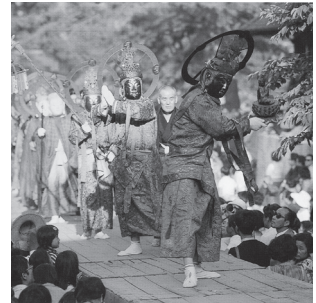
도 8 迎講

일본의 아미타내영도상은 정면을 바라보거나 혹은 화면의 향좌측에서 향우측으로 구름을 타고 속도감 있게 내려오는 모습이 특징적이다(도 9). 16 구름을 타고 내려오는 빠르게 내려오는 표현은 아미타정토에서 사바세계로 강림하는 형상을 강조하