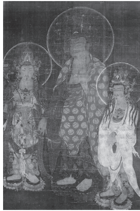
도 2 <阿彌陀三尊圖>, 高麗 14세기, 비단에 채색, 103.0×68.0cm, 일본 교토 지은지(知恩寺)