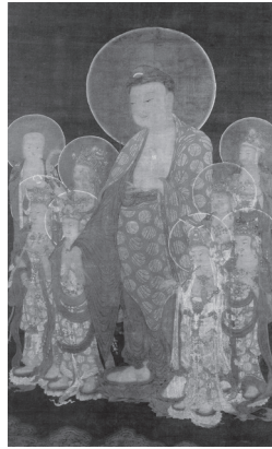
도 3 <아미타팔대보살도>, 고려 14세기, 비단에 채색, 143.0×87.0cm, 일본 아이치(愛知)현 토쿠가와미술관(徳川美術館)