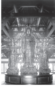
도 12 <아미타삼존상>, 헤이안 12세기 후반, 목조, 일본 교토 조토지(淨土寺)