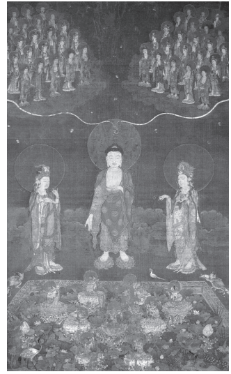
도 17 <아미타정토도>, 남송 1180년, 비단에 채색, 150.5×92.0cm, 일본 교토 지온인(知恩院)

(도 15). 정면향을 한 아미타삼존이 모두 서 있다는 점에서 아미다지본 <16관변상도>의 13관 도상과 유사하다(도 16). 『관경』에 의하면 13관은 ‘여섯 장이나 되는 불상 한 분이 연못 위에 계신 것을 관할지니라’라고 쓰여 있어 원래 연못 위에 서있는 아미타불을 관상하는 관이다.