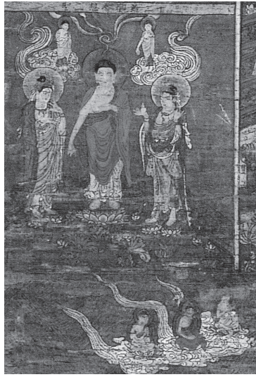
도 16 13관, 도 11의 부분