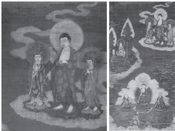
도 18 <관경서분변상도>, 남송~원, 비단에 채색, 112.9×59.7cm, 일본 나라 엔쇼지(圓照寺)

측면을 향한 채 허공의 구름을 타고 있는 아미타불의 형상은 일본 엔쇼지(圓照寺) 소장인 남송~원대의 <관경서분변상도>에서 확인된다(도 18, 18-1). 하단에 위제희왕비가 석가모니불에게 설법을 듣고 있는 장면이 묘사되고, 중단의 오른쪽에는 위제희왕비가 승려와 함께 수행을 하고 있으며 상단의 왼쪽 허공에는 긴 꼬리를 단 구름 위에 아미타삼존의 표현되어 있다.