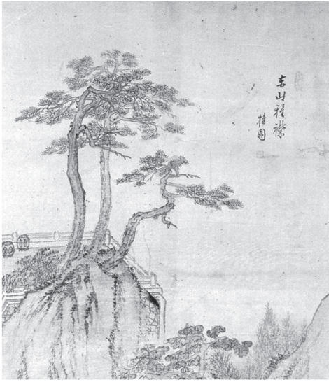
도 12-1 화면 상단의 '東山雅襟' 畫題

것을襟(옷깃)"이라 했다. 44 『說文解字·衣部』에서도 “衽은 옷깃(衣衽)이며, 衽은 ‘任(옷깃)을 교차하는 것이다. 衽은 衿자로 변하고 다시襟자로 변한다”했음을 찾을 수 있다. 45 屈原(?BC 343-?BC 277)의 『離騷經』에서도 “눈물이 내 옷깃을 줄줄 흐르네”라고 하였다. 46