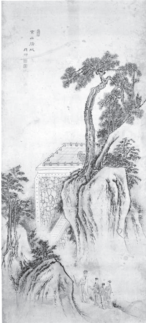
도 13 金弘道, 〈東山携妓〉, 18세기, 종이에 담채, 111.9×52.6cm, 간송미술관(『檀園 金弘道·탄신 250주년 기념 특별전』, 圖172)