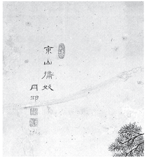
도 13-1 화면 상단의 ‘謝安携妓’ 畫題