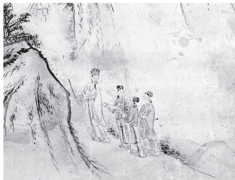
도 13-3 화면 하단의 謝安携妓

적혀있다(도 13-1). 그 주위로 ‘丹丘’ 71 의 글자와, ‘心醉好求’, ‘弘道’ ‘土能’의 도장을 찾을 수 있다. 오른쪽으로 쏠린 화면의 무게를 적절히 조절하고 있다. 石築의 유상처는 『개자원화전』의 「人物屋宇譜」중 ‘平臺式’을 본뜬 것으로 보인다(도 13-2). 72