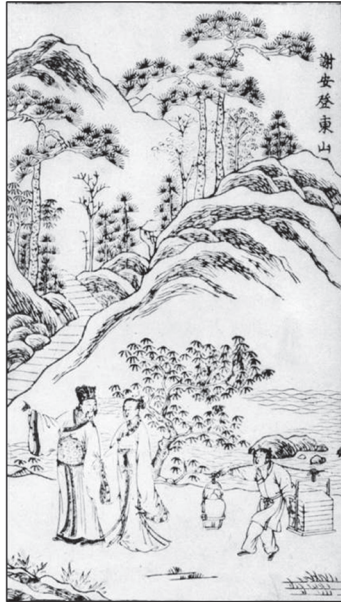
도 8 〈謝安登東山〉, 《山水爭奇插圖》, 1624, 上海圖書館『中國美術全集·繪畫編』20, 上海人民美術出版社, 1988, 圖134)

추앙되었고, 이 시기에는 기녀를 동반하고 유상하는 풍조가 성행했음을 보여준다. 25 이 작품은 다음장에서 살펴 볼 김홍도의 〈동산아금〉과 〈동산휴기〉의 양식분석에 있어 중요한 상관성을 지닌다.