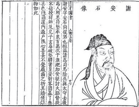
도 1 <謝安石像>, 『人物五卷』 『三才圖會』, 明(『三才圖會』 2권, 成文出版社有限公司, 1970)

후에 부견이 백만 대군을 비수 부견에 이끌고 침입했을 때 정토대도독에 임명되었다. 조카 사현 등이 부견의 군사를 크게 대파했다는 승전 보고를 받고도 손님과 바둑을 두었다. 감정을 억누르고 분위기를 제압하는 것이 이와 같았다. 그 공으로 총통에서 태보에 승진했다. 6