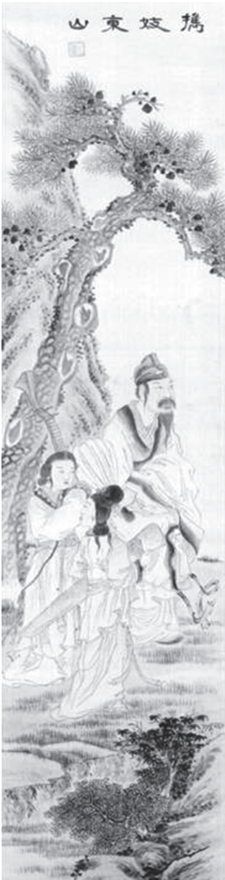
도 14 趙錫晉, 〈携妓東山〉, 19세기, 비단에 채색, 32.5×144.8cm, 간송미술관(『간송문화』 78, 한국민족미술연구소, 2010, 圖20)

이처럼 <동산휴기>에는 ‘풍류’라는 두 글자로 역사에 이름을 남긴 사안의 맑고 깨끗한 모습이 강조되었을 가능성이 제시된다. 사안에 있어서 풍류는 바로 커다란 공명을 당대에 거두면서도 자신의 진실한性情을 잃지 않은 것이다. 중국과 조선시대 사람들의 마음속에서 가장 완벽한 이상향으로 칭송되었던 것으로 생각된다.