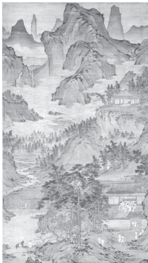
도 4 〈東山絲竹圖〉, 元, 비단에 채색, 187.5×43.7cm, 北京故宮博物院藏(『故宮博物院藏品大系·繪畫編』6, 紫禁城出版社, 2008, 圖66)

沈周(1427-1509)의 〈做戴進謝安東山圖〉(1480)도 살펴볼 수 있다(도 6). 청록산수화풍으로 그려졌으며, 높은 산과 봉우리는 그림 속의 대부분의 공간을 차지한다. 화면의 좌측 상단에 ‘錢塘戴文進謝安東山圖庚子長洲沈周臨’이라 쓰여 있다. 사안이 지팡이를 짚고 거