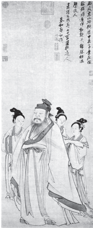
도 7 郭詡, 〈東山携妓〉, 1526, 종이에 수묵, 123.8×49.9cm,臺北故宮博物院(Painters of the Great Ming: the Imperial Court and the Zhe School, 圖148)

니는 가운데 한 마리의 백록이 앞서고 있으며, 사안의 뒤로 4명의 기녀가 따르고 있다. 명대 동진문인들의 풍류가