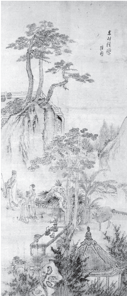
도 12 金弘道, 〈東山雅襟〉, 18세기, 비단에 담채, 98.2 × 48.5cm, 국립중앙박물관(『檀園 金弘道·탄신 250주년 기념 특별전』, 삼성문화재단, 1995, 圖179)

산도의 성격구명을 시도할 것이다. ‘濟世蒼生’과 ‘風流瀟灑’로 대별하여 그 시각적 표상의 함의가 집중 논의된다. 조선시대 중국의 역대인물 중 후대 사람들이 받들고 따라야 할 모범적 사례로 사안의 풍모가 칭송되었던 것으로 보인다.