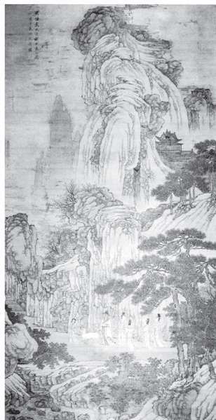
도 6 沈周, 〈做戴進謝安東山圖〉, 1480, 비단에 채색, 170.3×90.3cm, 美國翁萬戈先生藏(『海外藏歷代名畫』6, 圖1)