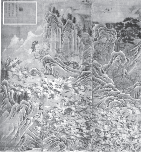
도 10 〈謝玄破秦百萬兵圖〉부분, 1715, 비단에 채색, 170×418.6cm, 國立中央博物館(『왕의 글이 있는 그림』, 국립중앙박물관, 2008, 圖18)