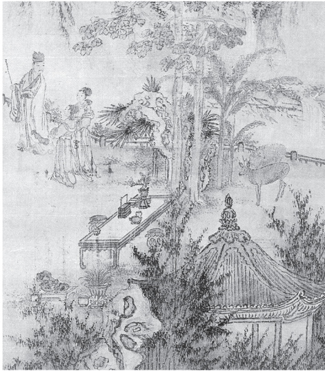
도 12-2 화면 하단의 謝安携妓와 景物

다음으로는 화면의 분석이다. 상단에 그려진 높은 석축의 유상처는 사안과 기녀가 함께 오르려는 장소이다. 석축의 유상처 위로 구멍 뚫린 두 개의 透刻 敦 이 놓여져 있다. ‘동산아금’의 화제가 적혀 있는 것으로 볼 때 유상처는 절강성의 회계 동산일 것이다. 그러나 앞서 살펴본 『회계지』에 수록된 동산의 험준함을 표현한 내용이나, 『三才圖會』의 〈東山圖〉(도 2), 그리고 심주의 〈傲戴進謝安東山圖〉(도 2) 등에 표현된 깊고 높은 산세의 동산의 모습과는 차이를 드러낸다.