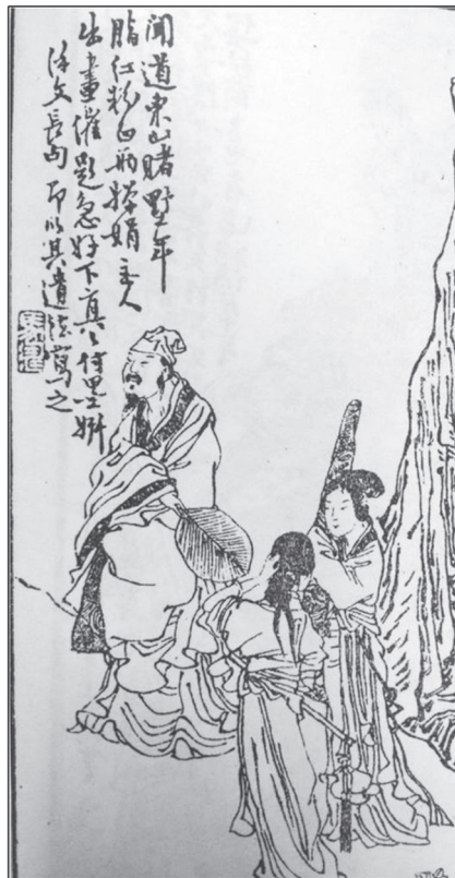
도 15 馬壽, 〈携妓東山〉, 『詩中畫』, 1885, 국립중앙도서관

이외에 간송미술관 소장의 趙錫晉(1853-1920)의 〈携妓東山〉도 있다(도 14). 화면의 상단에 ‘携妓東山’의 화제가 적혀있으며, 비파와 쯤을 든 두 명의 기녀와 함께 사안이 동산에 오르는 모습이 담겨있다. 도상이 점차 단순화되고 더욱 축약되는 모습을 보여준다. 중국의