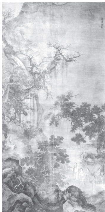
도 3 傳樓觀,〈謝安東山圖〉,南宋,비단에 수묵, 175.9×88.3cm, Mr and Mrs John D. Rockefeller III Collection(『海外藏歷代名畫』3, 湖南美術出版社, 1998, 圖 77)

石携妓東山圖 15 , 송대 李公麟(약 1041-1106)의 〈東山圖 16 , 崔白(약 1050-1080 활동)의 〈東山圖〉·〈謝安登東山 17 , 劉松年(약 1150-1225 이후)의 〈東山絲竹圖〉등을 찾을 수 있다. 18 또한, 乾隆年間(1736-1795) 황명으로 간행된 陳邦彥(1678-1752)의 『御定歷代題畫詩』의 ‘사안동산도’ 관련의 題跋을 통해서도 살펴볼 수 있다. 송대 朱子(1130-1200)의 「題謝安石東山圖」를 비롯하여, 원대 虞集(1272-1348)의 「題趙師舜謝安遊東山圖」, 王惲(1228-1304)의 「謝太傅東山圖 金黎陽李公泰筆 二首」, 吳鎮(1280-1354)의 「趙仲穆東山圖」, 丁鶴年(1335-1424)의 「題謝安觀山圖」, 그리고 명대 吳寬(1435-1504)의 「謝安遊東山圖」, 徐渭(1521-1593)의 「謝太傅携妓東山圖」 등이다. 19