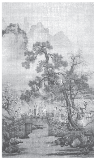
도 5 〈謝安東山〉, 《四時山景圖》, 明, 비단에 채색, 83.9×53.0cm, 日本彦根城博物館藏(『海外藏歷代名畫』5, 圖89)