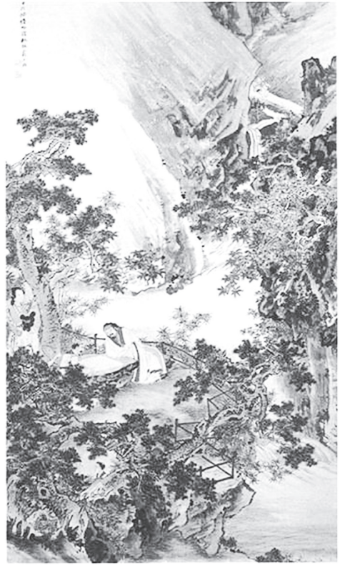
도 11 蘇六朋, 〈東山報捷圖〉, 淸, 종이에 채색, 238×117cm, 廣州美術館

도 찾을 수 있다(도 10). 사안의 조카 사현이 부견의 백만 대군을 물리쳤던 전투를 주제로 한 그림이다. 속종은 마지막 화면 위쪽에 “진나라의 사안은 뛰어난 명성이 있어 전진왕 부견의 백만 병사를 앞서서 물리쳤다”하였다. 40 국왕이 그림을 통치에