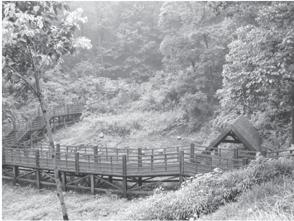
도 1 老虎洞窯址 全景

터 이 요장을 교단하관요로 파악한 것은 주로 금세기에 접어들기 이전까지의 고고학적 근거를 토대로 한 것이었다. 즉 “殊勝二處”의 뛰어난 자기를 소조한 요장은 필경 관요일 터인데, 그때까지 임안, 즉 오늘날의 항주에서 그러한 관요지가 발견된 것은 교단하관요지 뿐이었다. 따라서 그들은 기본적으로 임안에 수내사관요가 있었다는 점에 회의적이었