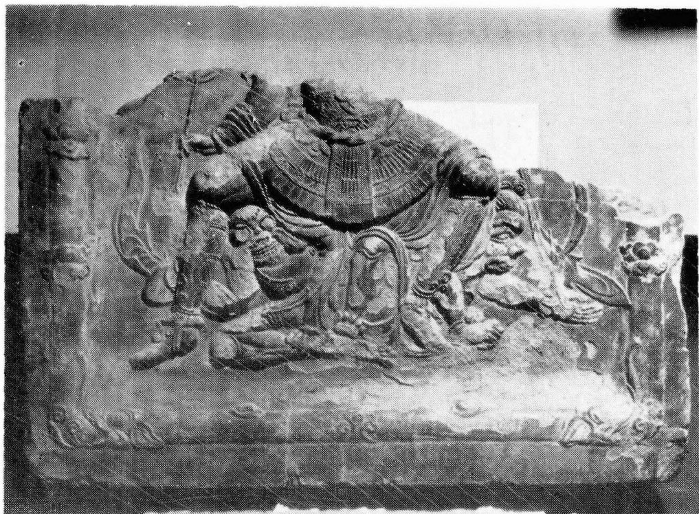
圖 7. 第二四天王像埴片(國立中央博物館所藏)