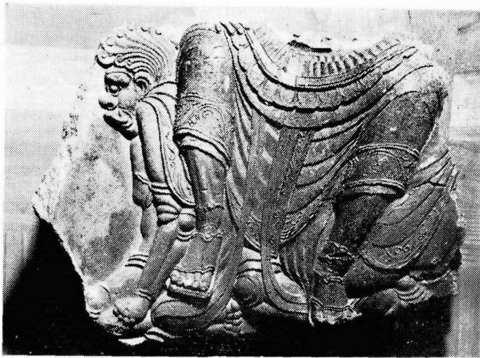
圖 3. 第一四天王像埴片(個人所藏)