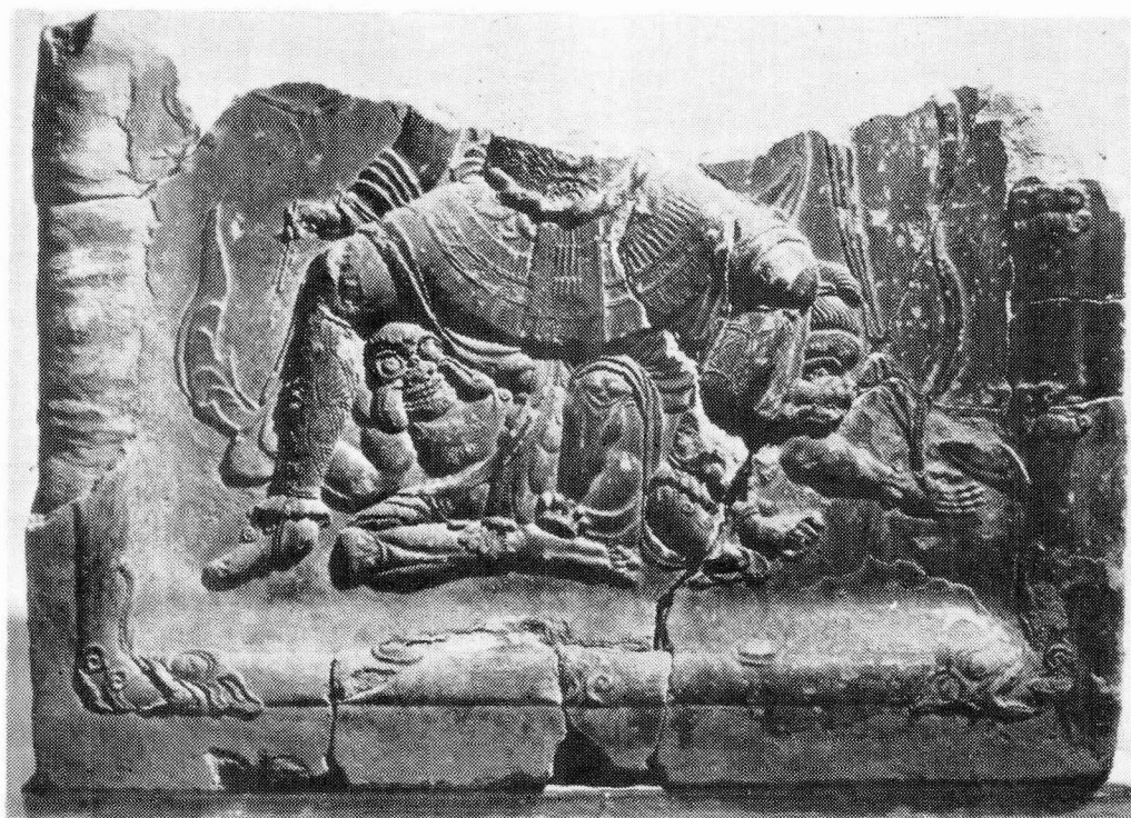
圖 6. 第二四天王像埴片(國立慶州博物館所藏)