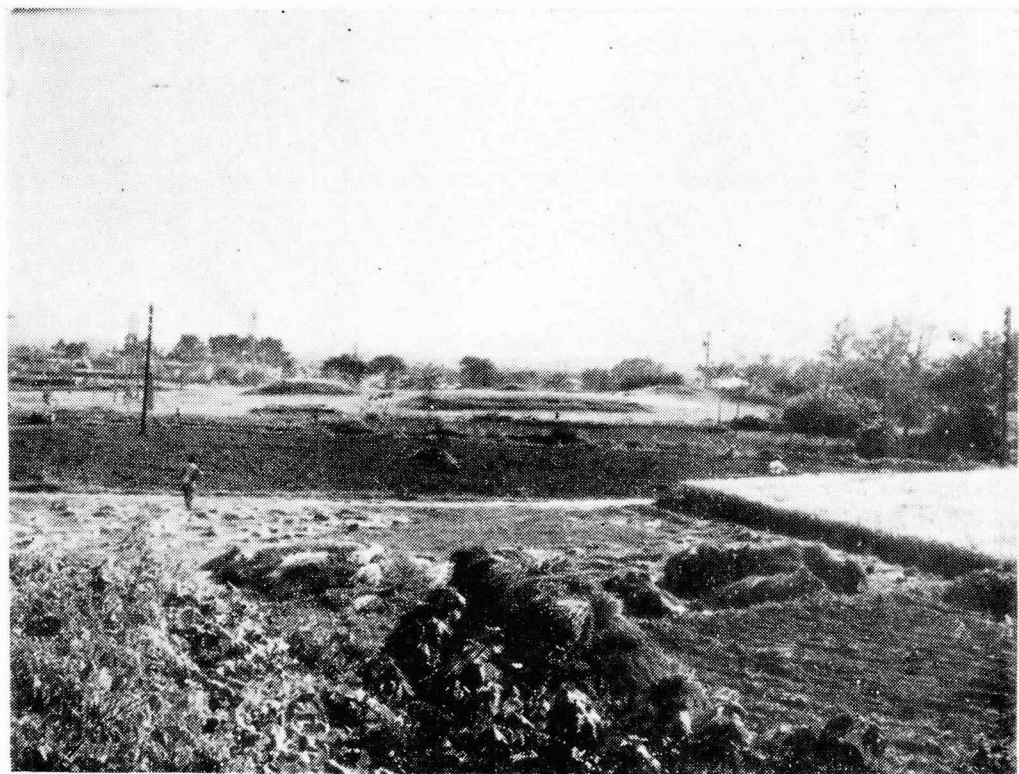
圖 1. 四天王寺址 全景