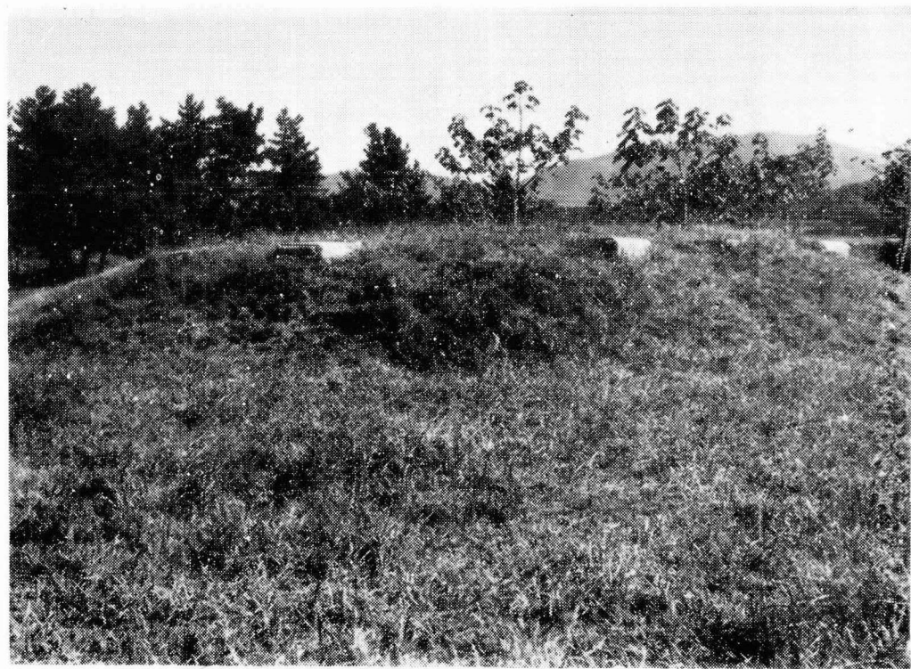
圖 2. 四天王寺址 東塔址