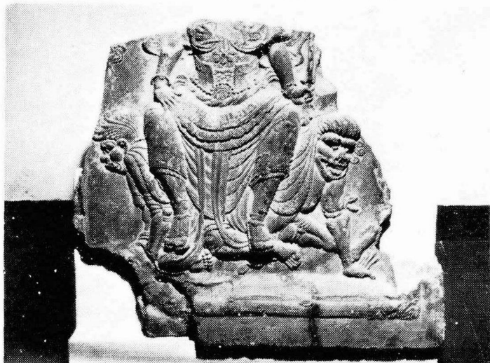
圖 5. 第一四天王像埴片(國立中央博物館所藏)