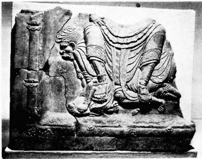
圖 4. 第一四天王像埴片(國立慶州博物館所藏)