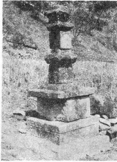
花崗石 方形의 三層石塔으로서 二層基壇上에 建立되었는바 地臺石과 下層基壇은 一石이며 下基中石 側面에는 各面마다 一區씩의 眼象을 彫刻하였는데 眼象內에 귀꽃모양을 裝飾한 手法이 注

京春線으로 江村驛에서 下車하여 約四km 倉村에서 다시 倉村里二區塔內洞(塔안)으로 四km 더 가면 밭 가운데(洪상홀氏 所有地) 現高 約二·四m의 石塔 一基와 蓮花座臺 및 礎石 各一座가 現存하며 周週에는 瓦片이 散在하고 있다.