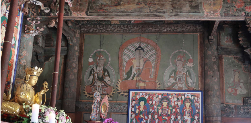
Fig. 16. <범어사 대웅전 동벽의 벽화와 단청> Murals and Tanch'ong on the East Wall of Tae'ungjŏn Hall, Pŏmŏsa Temple, Busan