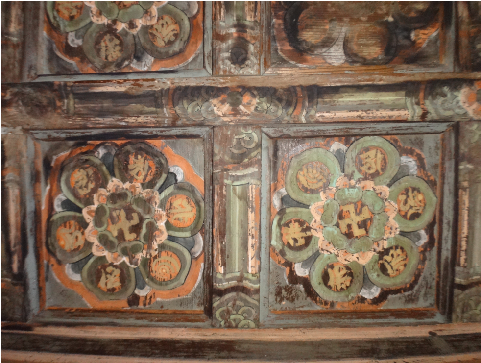
Fig. 19. <신홍사 대광전 천장 단청> Tanch'ŏng on the Ceiling of Taegwangjŏn Hall, Shinhŭngsa Temple, Yangsan

등 다양한 대중적 요구를 수용하는 복합적인 제의 공간으로 기능했음을 의미한다. 당시 대광전 내부 역시 이러한 시대적 흐름에 따라 삼단의 형식을 갖추었을 것이며, 일상적인 예불 시식이나 각종 제회 또한 이 삼단 의례의 범주 안에서 선행되었을 것이다. 그러나 이곳의 삼단 구조는 통상적인 사찰의 그것과는 다른 층위를 지닌다. 가장 큰 딜레마는 상단에 봉안되어야 할 ‘삼불’ 중 아미타여래와 약사여래가 물리적으로는 중단과 하단이 위치해야 할 측벽에 배치되어 있다는 점이다. 그렇다면 이 공간적 모순은 17세기 이후의 실제 의례 현장에서 어떻게 해소되었을까?