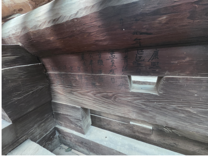
Fig. 3. <단청기문, 신흥사 대광전 내부 평면도> Record of Decorative Coloring and Floor Plan of Taegwangjŏn Hall, Shinhŭngsa Temple, Yangsan

2024년 7월 대광전 건물 변위 조사 과정에서 정면 우협칸 주심도리 장혀에서 발견된 단청기문(丹青記文)을 통해 새롭게 확인되었다(fig. 3). 11 『신흥사대웅전단청기문』에 의하면 강희 29년(1690) 윤3월에 단청 불사가 이루어졌으며, 화원으로 현율(玄律)과 종신(宗信) 등이 참여했음을 확인할 수 있다. 비록 기문 내에 벽화 제작에 관한 직접적인 서술은 보이지 않으나, 당시 불전 장엄의 관행상 단청과 벽화가 병행되는 경우가 일반적이라는 점을 고려할 때 벽화 역시 1690년경에 함께 조성된 것으로 보아도 무방할 것이다. 이는 그간 삼세불도 양식 추정시기와도 일치한다. 12 결과적으로 신흥사 대광전의 전각 건립(1657) → 불상 봉안(1682) → 단청 및 벽화 조성(1690)이라는 일련의 장엄 절차는 약 30~40년의 시차를 두고 단계적으로 진행되었다. 이러한 장기적 조성 과정은 당시 사찰의 재정 상황과 지역 사찰의 현실적 여건과 밀접한 관련이 있었을 것이다.