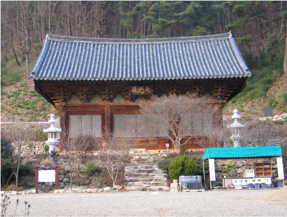
Fig. 1. <신흥사 대광전 외부> Exterior of Taegwangjŏn Hall, Shinhŭngsa Temple, Yangsan