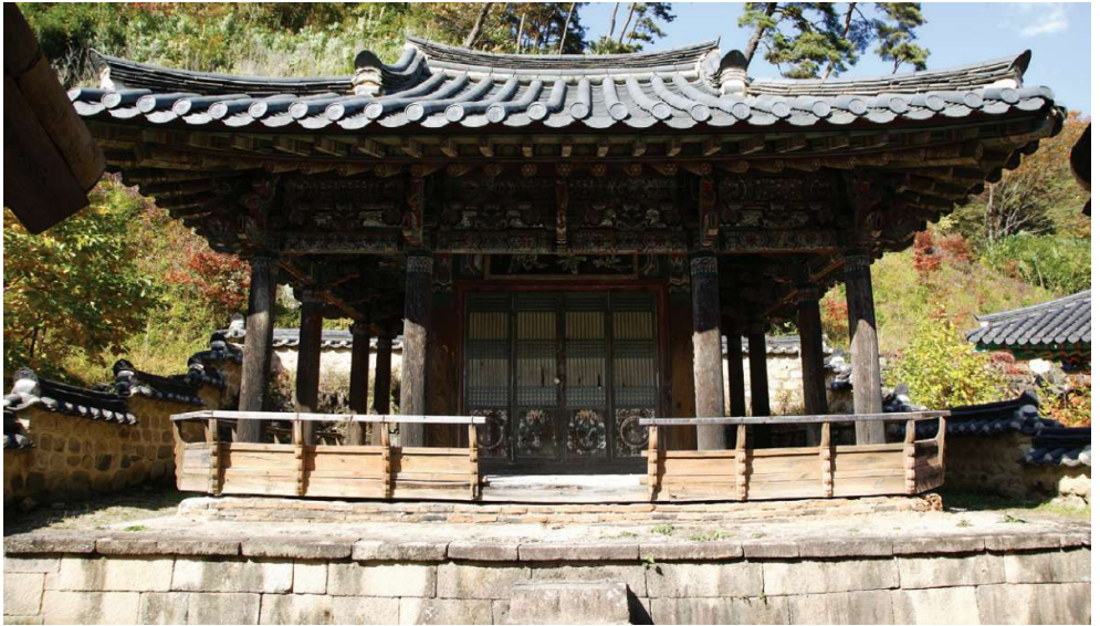
Fig. 18. <고운사 연수전> Yönsujön Hall of Kounsa Temple , 1744, Chosŏn, Kounsa Temple, Uisong (Munhwajae Ch'öng · Söngbo Munhwajae Yön'guwön, Kyöngbuk sach'al pogosö, 2011, p. 589)

러싼 ‘정면 3칸, 측면 3칸’의 평면 형식을 의미한다. 지붕의 구체적인 형태는 알 수 없으나, 이러한 구조적 특징은 오늘날 고운사 연수전 등에서 그 원형을 확인할 수 있다(fig. 18). 30 이는 중앙 불단을 중심으로 사방을 순환하며 예배하는 ‘행도’의 동선을 건축적으로 형상화한 것이다.