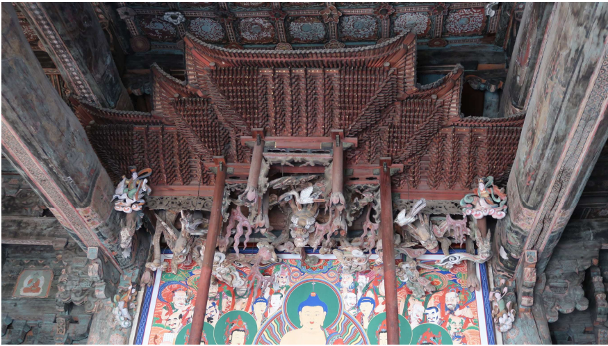
Fig. 17. <범어사 대웅전 단집> Canopy of Tae'ungjŏn Hall, Pŏmŏsa Temple, Busan

이는 범어사가 다양한 신앙적 요구를 수용하며 공간의 기능적 변용을 피한 것과 달리, 신흥사는 삼불 신앙의 순수성을 유지하며 여래의 상주처를 구현하는 데 집중했음을 실증한다.