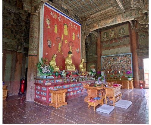
Fig. 2-1. <신흥사 대광전 내부 후불벽과 서벽> Rear-partition Wall and West Wall inside Taegwangjŏn Hall, Shinhŭngsa Temple, Yangsan