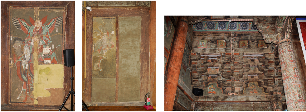
Fig. 11. <팔부중의 일부, 신흥사 대광전 서벽 하단 측벽 팔부중도> Detail of the Eight Guardians on the West Wall of Taegwangjŏn Hall, Shinhŭngsa Temple, Yangsan