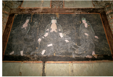
Fig. 6. <대광전의 불단과 후불벽> Buddhist Altar and Rear-partition Wall of Taegwangjŏn Hall, Shinhŭngsa Temple, Yangsan